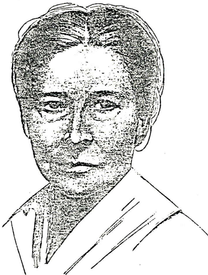
AUGUSTA DE WIT

9 februari 1939 overleed in pension Groot-Malvahoeve, Cantonlaan 19 te Baarn, de bekende schrijfster Augusta de Wit.