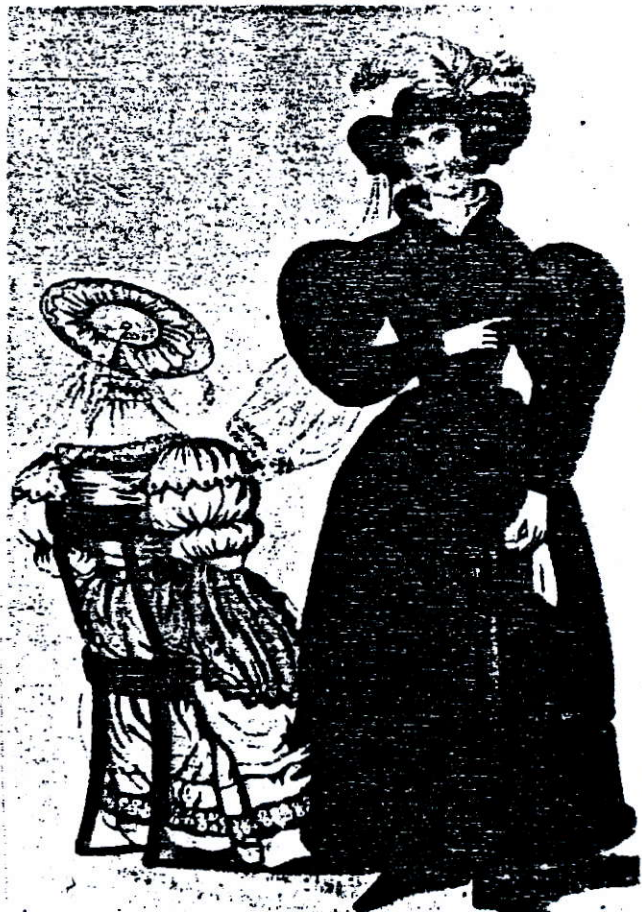
Nederlandse wandelkleding uit het tijdschrift: „Euphrosine 1830.