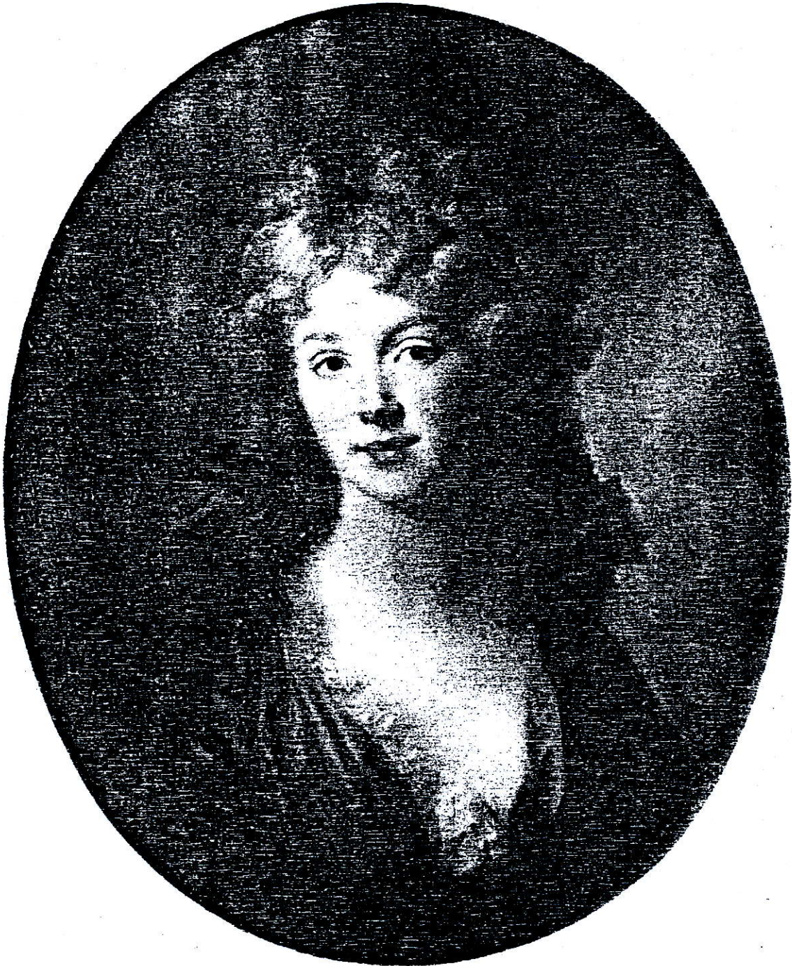
FREDERICA LOUISA WILHELMINA, Prinses van Pruisen, gemalin van Z. M. Koning WILLEM I.