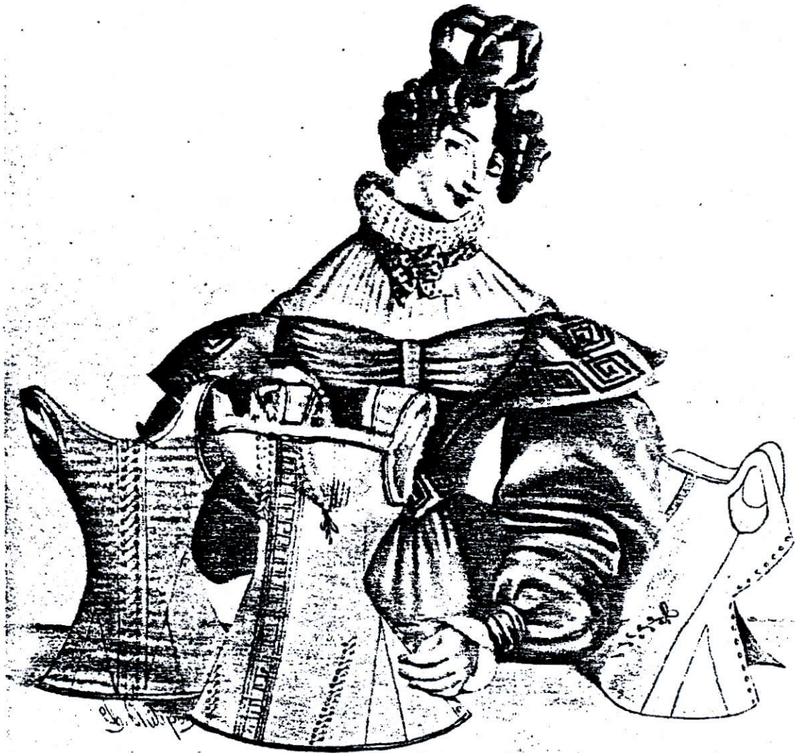
Franse mode 1830.