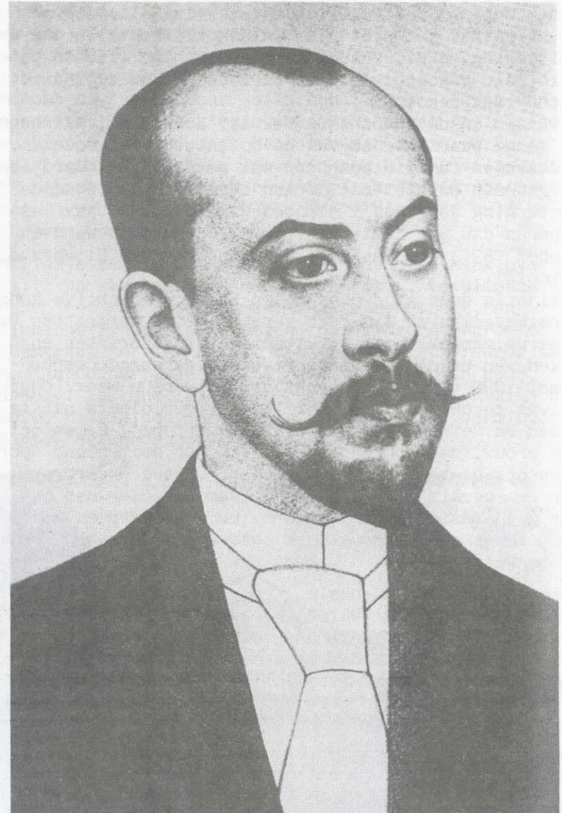
Louis Couperus in 1892.

"Op de jaarlijksche vacantiereisjes der familie Couperus was de Veluwe en het Gooi dikwijls bezocht. Bijzonder bekoord was Couperus geweest door de omstreken van Baarn en Hilversum...."