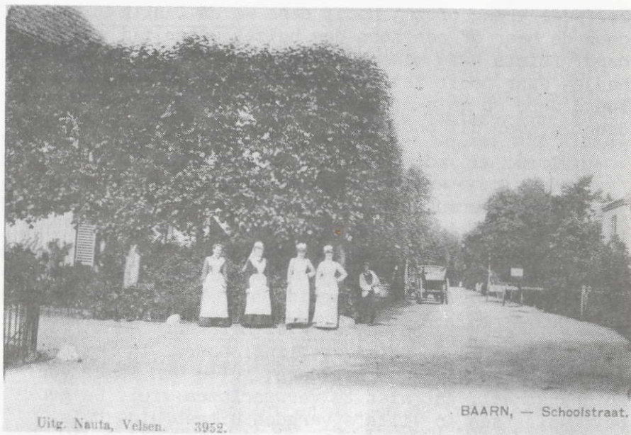
Uitg. Nauta, Velsen. 3952.