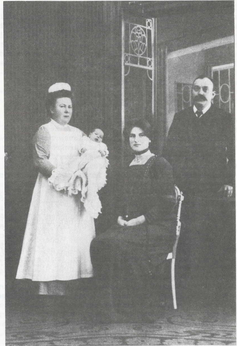
Gezin met dienstbode in 1912.