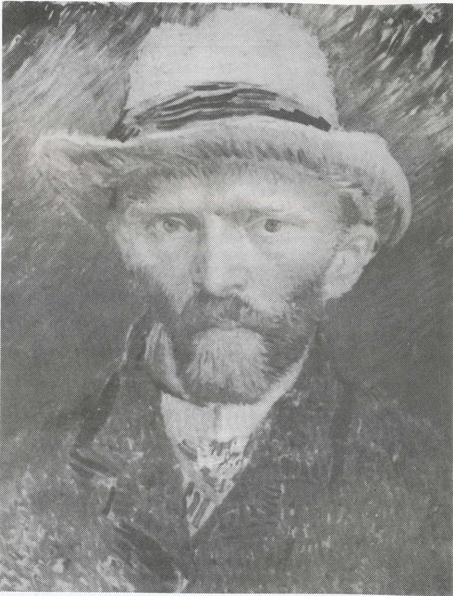
Zelfportret van haar broer Vincent.

Ze trouwt met Jean Philippe Theodorus du Quesne van Bruchem, gefortuneerd en rustend advocaat en procureur, geb. te Oosterbeek in 1840 en overleden te Baarn in 1921. Het gezin telt 4 kinderen, die tussen 1892 en 1899 geboren worden, en woont aanvankelijk te Soesterberg op het buiten "De Eikenhorst".