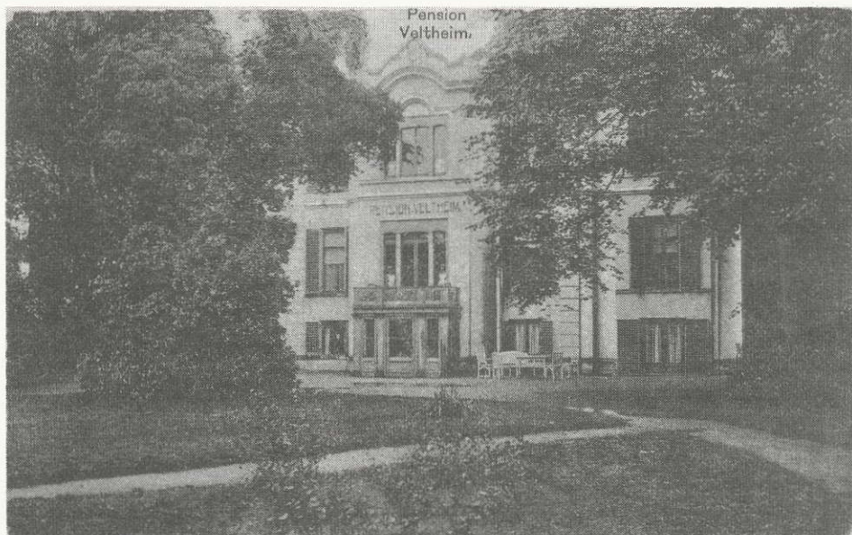
Achterzijde van villa Veltheim.