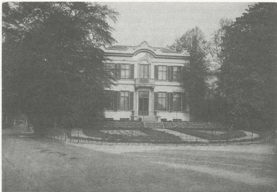
Pension Veltheim rond 1900.