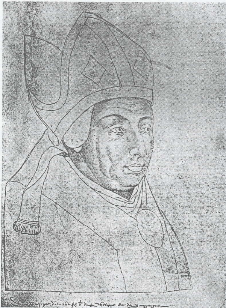
DAVID VAN BOURGONDIË, BISSCHOP VAN UTRECHT VAN 1456 TOT 1496.