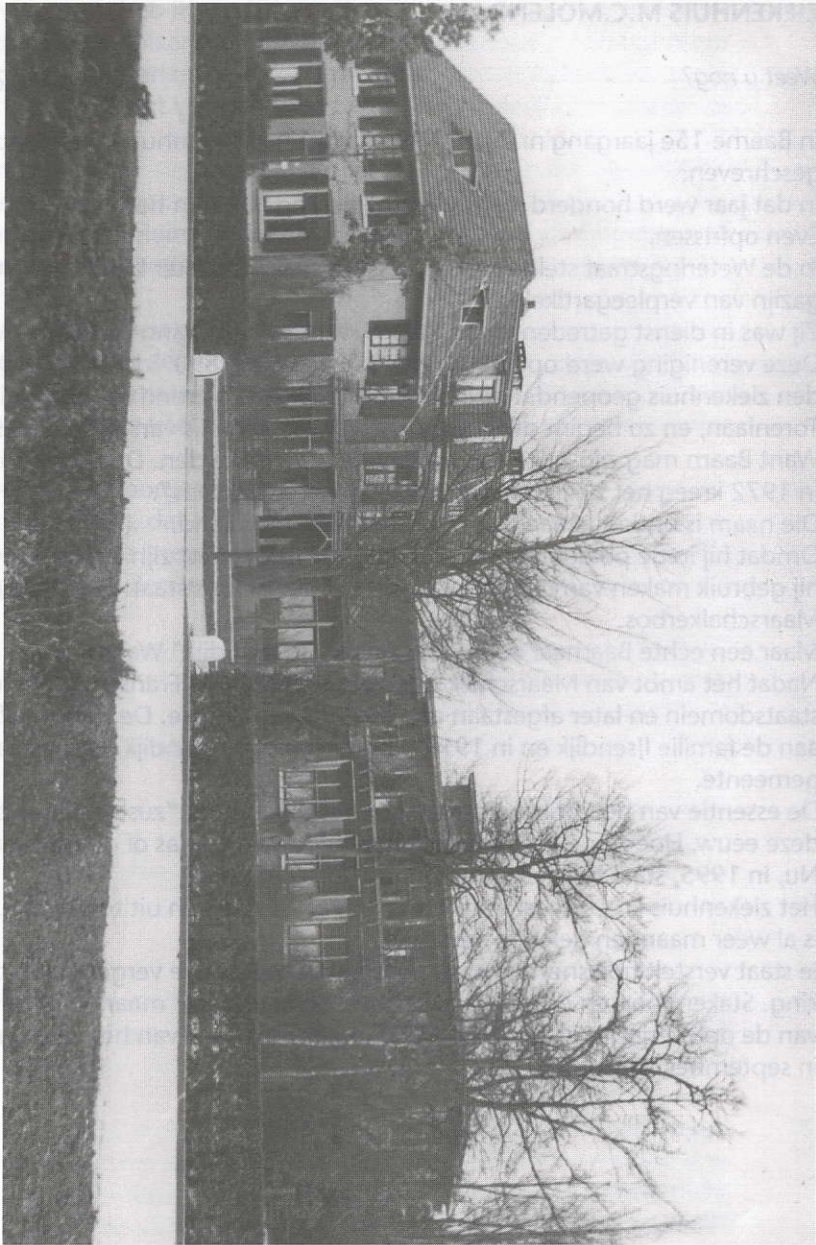
Ziekenhuis Torerlaan met aanbouw