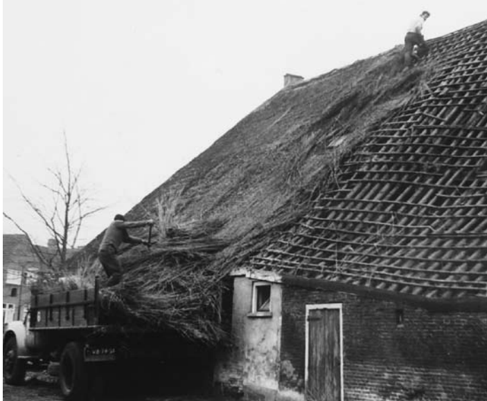
Sloopwerkzaamheden aan een boerderij aan de Zandvoortweg