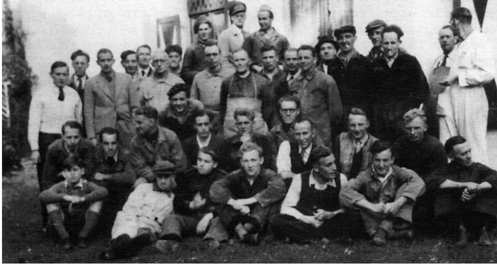
Groepsfoto van medewerkers van de Kodafabrik in de jaren vijftig

dag wendt hij zich tot de bosbaas van pa-leis Soestdijk en doet hem een voorstel. Na overleg met de rentmeester kan hij het hout voor f 7,50 de kubieke meter kopen. De productie kan eindelijk van start gaan.