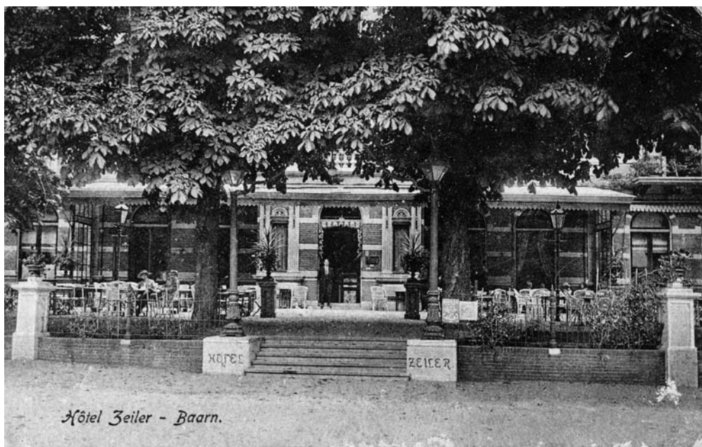
Hotel Zeiler ten tijde van de fam. Zeiler