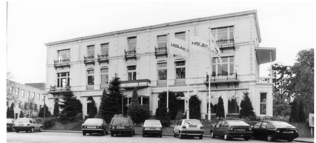
Het gebouw ten tijde van Holec

Na anderhalf jaar, toen Smit al vertrokken was, besloot de directie het pand al weer af te stoten, om te verhuizen naar een reeds bestaand groot kantoorpand in Amersfoort, op het industrieterrein De Isselt, waar ze ook reeds verkoopvestigingen bezat. Door de nieuwe ontsluitingsweg was het concern daar goed bereikbaar.