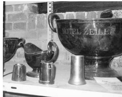
Losse hotelpulletjes

In 1962 probeerden twee nieuwe eigenaren het nog eens. Het waren de heren Nix en Baarda die, verenigd in de exploitatie maatschappij Aleos, al het zo befaamde 17e-eeuwse hotel De Zalm in Gouda en hotel Marconi in Bergen aan Zee bezaten. Zij gaven het Baarnse hotel een nieuwe naam, Hotel Royal (waarschijnlijk om de koninklijke uitstraling van Baarn); zij wilden dit hotel weer in