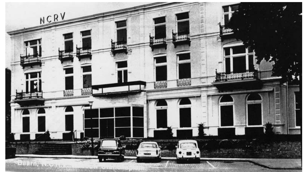
Het gebouw ten tijde van de NCRV (van F.W. Mulder, via Th. Hagethorn)

Hierna werd het pand in 1967 pas echt door de NCRV in gebruik genomen met beneden het ontvangstcentrum met de directie, verder met de afdeling organisatie en propaganda, de ledenadministratie en de financiële administratie, het secretariaat, en heel kort de redactie en advertentie-aquisitie van de omroepgids (die gedrukt werd bij C. de Boer in