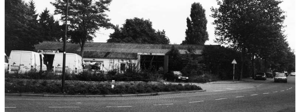
Het oude pand van Koda aan de Acacialaan in de jaren vijftig

Halverwege de jaren tachtig vat Gert het plan op om het fabrieksterrein om te bouwen tot bedrijfsverzamelgebouw en wil zodoende onderdak bieden aan meerdere bedrijven. Maar dat plan stuit zeer tegen de borst van de gemeente, die het niet binnen het bestemmingsplan van Noordnoordwest vindt passen.