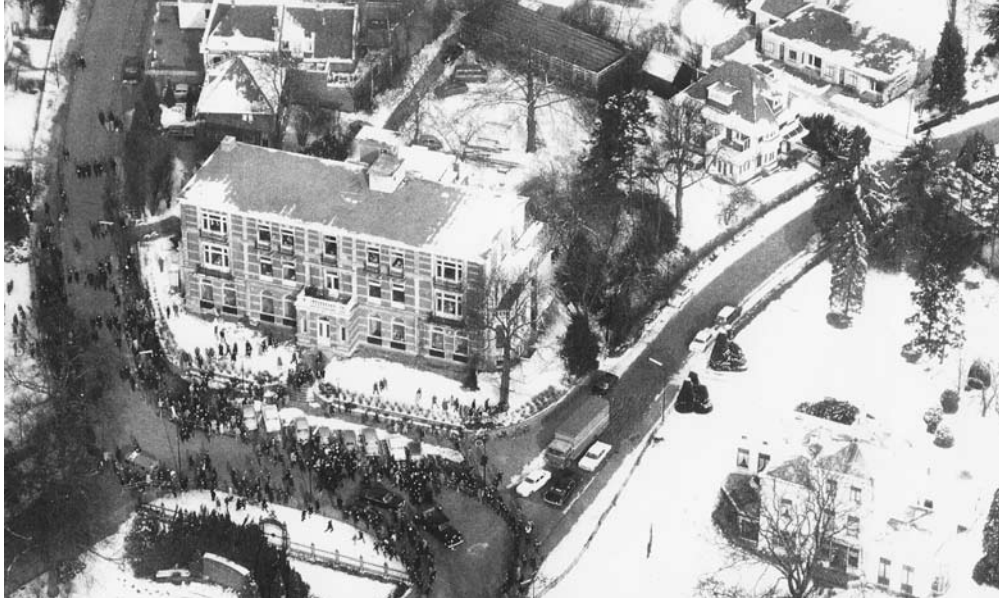
17 febr. 1966; Het gebouw met ervoor de rijtoer van prinses Beatrix en Claus na hun ondertrouw (deelkopie van 'Oud Baarn vanuit de lucht')

la Promenade (De Prom) toen en nu moedig stand. Er kwamen wel nieuwe hotels bij, zoals hotel-café-restaurant Groeneveld en later Onder de Linden in de Hoofdstraat, maar als hotel zijn deze ook al weer afgevallen. Nu heb je naast 'La Promenade' alleen nog in het buitengebied hotel De Hooge Vuursche en in Lage Vuursche hotel De Kastanjehof.