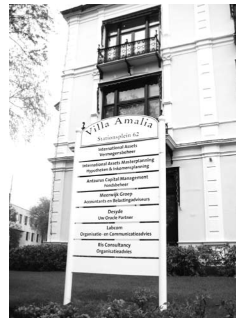
De huidige huurders van het pand