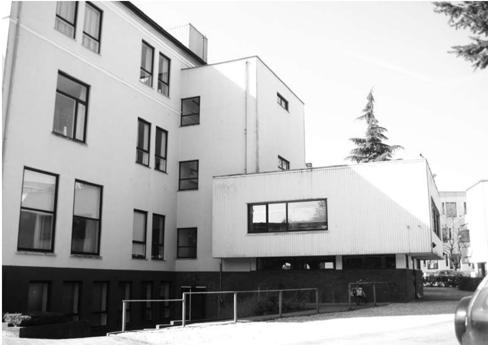
De blokkendoos

Hilversum) en de uitgave van de gids. Al met al in totaal zo'n zestig à zeventig medewerkers.