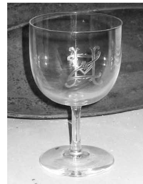
Glas met monogram 'HZ' (foto auteur, van coll. G. Meyer, Bergen aan Zee)

Toen was er in Baarn van al die hotels van weleer bijna niets overgebleven. Uiteindelijk hield alleen hotel De