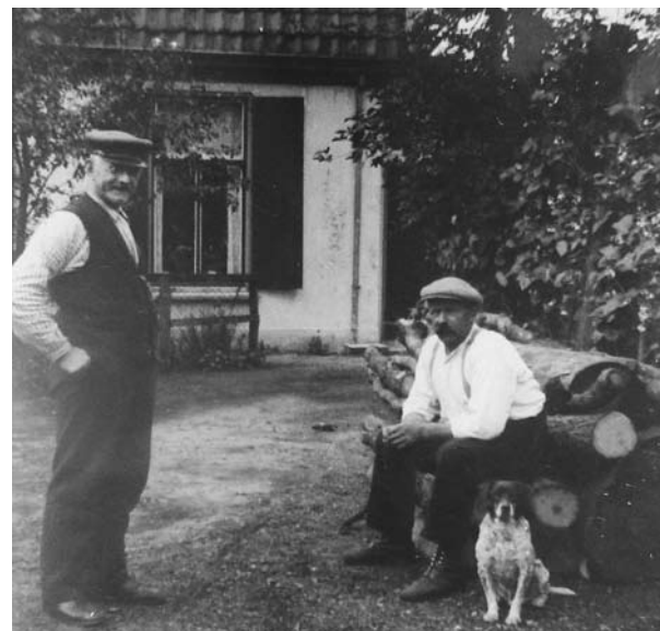
Zittend op boomstammen, de oprichter van het bedrijf voor zijn huis aan de Zandvoortweg