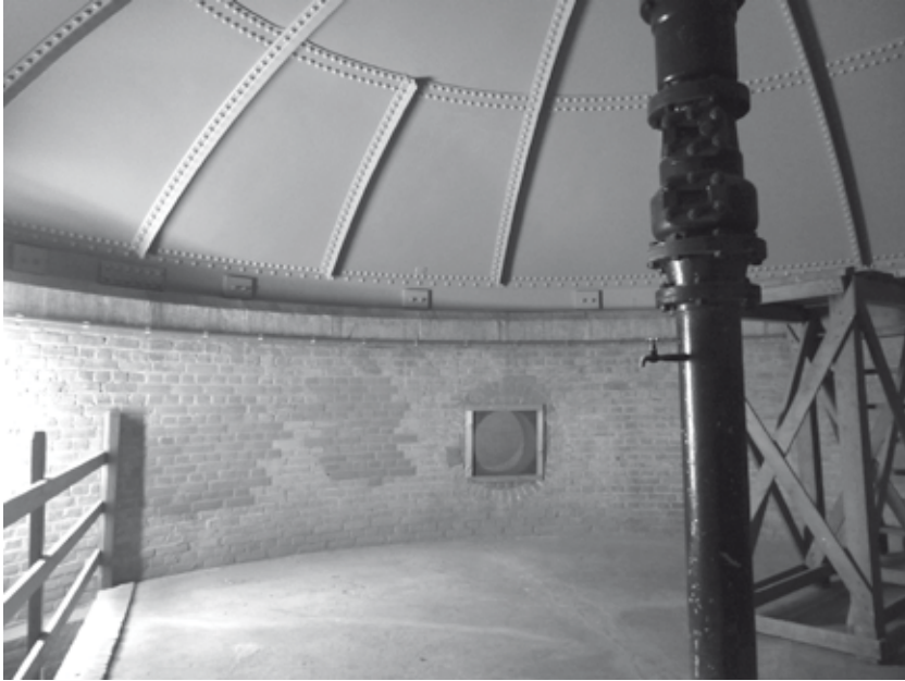
Onder het reservoir, watertoren aan de Sophialaan, bouwjaar 1903

Met de hierboven genoemde projecten is het in Baarn nog niet afgelopen op het gebied van herbestemming. Steeds weer zullen zich panden aandienen die op zoek zijn naar een nieuwe eigenaar en een nieuw gebruik. Na de perikelen rondom de Wintertuin in het Cantonspark komt nu op korte termijn het gebouw van de Nieuwe Baarnse School (NBS) aan de Smutslaan beschikbaar. Zou de villa, die ooit werd omgebouwd tot school, weer tot villa omgebouwd worden?