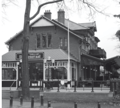
Voormalig buurtstation 'De Generaal', bouwjaar 1898

Los van de vele villa's die vanaf de jaren zestig van de twintigste eeuw zijn veranderd in kantoren, is er in Baarn een redelijk aantal geslaagde voorbeelden van herbestemming te vinden. Een van de oudste voorbeelden is wellicht De Generaal aan de Luitenant-Generaal van Heutszlaan 1-7. Dit pand werd gebouwd in opdracht van de Nederlandsche Centraal Spoorweg Maatschappij (NCS), als buurtstation van de in 1898 in gebruik genomen spoorlijn Den Dolder-Baarn. Deze spoorlijn was een aftakking van de lijn Utrecht-Zwolle en bedoeld voor forensenvervoer. Het stationsgebouw werd ontworpen door de Amsterdamse architect-ingenieur J.F. Klinkhamer (1854-1928), die ook tekende voor de stations Soest en Soestdijk langs deze lijn. Met de bouw van dit station beschikte Baarn opeens over twee stations en had de Hollandsche IJzeren Spoorweg Maatschappij (HIJSM), die reeds in 1873 een station had laten bou-