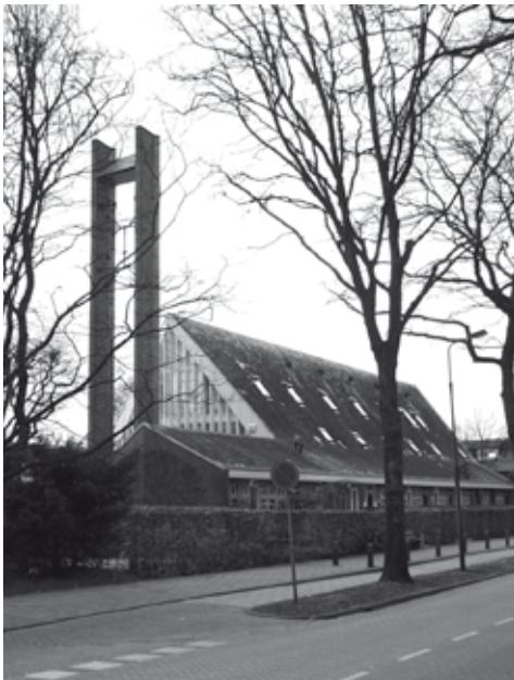
Opstandingskerk aan de Eemweg, bouwjaar 1965