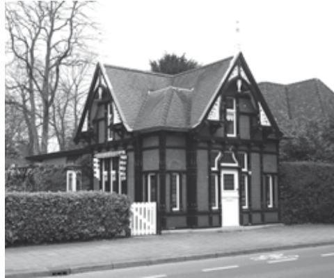
Telefooncentrale aan de Eemnesserweg, bouwjaar 1902

De voormalige telefooncentrale aan de Eemnesserweg werd in gebruik genomen als woonhuis, waartoe het in 1992 aan de achterzijde werd uitgebreid. Het postkantoor aan de Teding van Berkhoutstraat, dat in 1913 werd gebouwd naar ontwerp van rijksbouwmeester C.H. Peters (1847-1932), heeft eveneens een andere functie gekregen en doet sinds kort dienst als kinderdagverblijf. De naastgelegen telefooncentrale is inmiddels ook niet meer als zodanig in gebruik. Wellicht is ook dit een geschikt herbestemmingsobject?