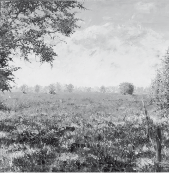
Schilderij De Stulp bij het Pluismeer, door C. Seleski

De afgelopen maanden werden maar liefst 52 artikelen toegevoegd aan de collectie van de Oudheidkamer. De giften zijn gevarieerd, o.a. boeken (7), elpees (7), dvd's (2), huishoudelijke (12) en bedrijfsvoorwerpen (4), documenten (3), een bouwtekening, kunst (5), insignes (2), speelgoed (2) en damesaccessoires (3).