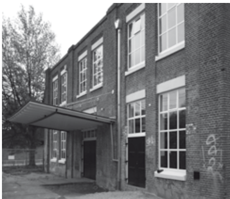
Voormalige weverij H.P. Gelderman & Zonen, Oldenzaal, bouwjaar 1863

den gevreesd; het staat al vijf jaar leeg. Langdurige leegstand is doorgaans nadelig, maar het kan ook positieve gevolgen hebben. Het grootste deel van de enorme textielfabriek H.P. Gelderman & Zonen in Oldenzaal ging - na jarenlange leegstand - in 1987 door brand verloren. Alleen de oude weverij uit 1863 bleef behouden. Sloop en de bouw van nieuwe kantoren op de plek van de weverij gingen door de economische recessie niet door, waarna de zwaar vervallen weverij werd opgekocht. Momenteel wordt het gebouw, dat beschikt over een unieke, gietijzeren constructie, opgeknapt en verbouwd tot bedrijfsverzamelgebouw. Ook nieuwbouw op de plek van voormalige stoom-luciferfabriek De Eem in Amersfoort is door de recessie voorlopig van de baan, maar wat er nu met het fabriekscomplex uit 1883 gaat gebeuren is nog onduidelijk.