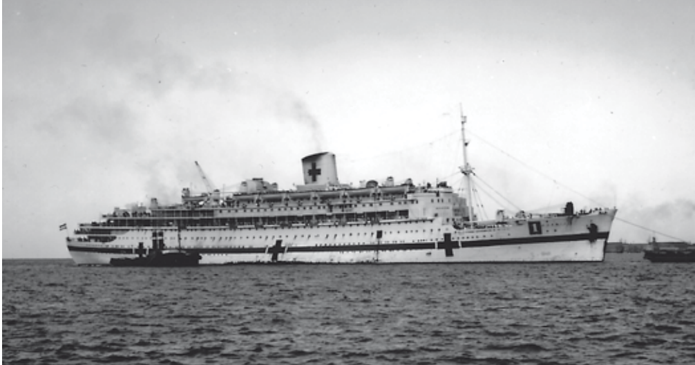
Ms Oranje van de SMN als hospitaalschip.

van Oldenbarnevelt. Het schip zou tot maart 1945 een varend 'thuis' voor hem zijn. Vanuit Balikpapan, Borneo voer het schip naar San Pedro, de haven van Los Angeles, en vervolgens via het Panamakanaal naar New York.