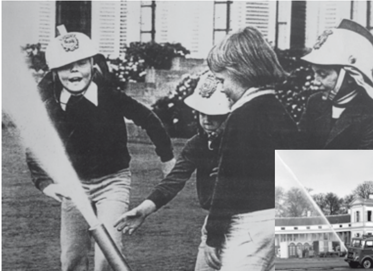
De prinsen van Oranje

In 1976 werd de brandweer van Baarn gevraagd of er demonstraties gegeven konden worden op Koninginnedag. Hiervoor zou veel water nodig zijn. Besloten werd om op 29 april een waterbassin te plaatsen in de tuin voor paleis Soestdijk. Het water werd opgepompt uit een geboorde waterput, gelegen achter de linkervleugel van het paleis.