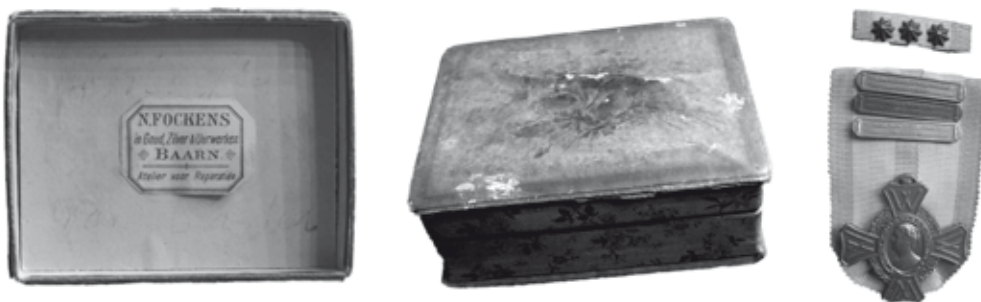
Een bijzondere vondst

en een draagbaton met drie sterren. Op de gespen staat te lezen: 'Oorlogsdienst 1940-1945, Middellandse Zee 1940-1945, en Oost Azië-Zuid Pacific 1942-1945. Dit alles maakt de medaille tot een zogenaamd Oorlogsherinneringskruis 1 . Deze medaille kon worden uitgereikt aan Nederlanders die de oorlogsjaren