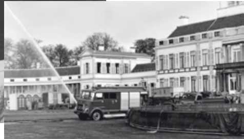
De brandweer bij het paleis

Tijdens Koninginnedag stond er een waterkanon in de paleistuin waar veel water uitkwam. Natuurlijk waren ook de prinsen van Oranje die dag aanwezig, waaronder prins Willem-Alexander. Omdat ze de brandweerhelmen erg stoer vonden, mochten de prinsen die lenen van de korpsleden.