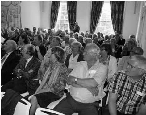
Een bomvolle zaal met aandachtig publiek

verpoosden beraamden op die lommerrijke buitenplaatsen allerlei plannen van staatsbelang waarvan de gevolgen ons land wereldwijd op de economische kaart hebben gezet. En die internationale oriëntatie behoort ook nu nog niet tot het verleden.