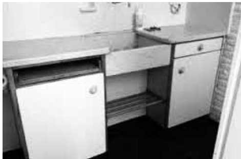
Een Bruynzeel keuken uit de vijftiger jaren

Helaas blijkt het oorspronkelijke ocriet niet goed bestand tegen moderne was-