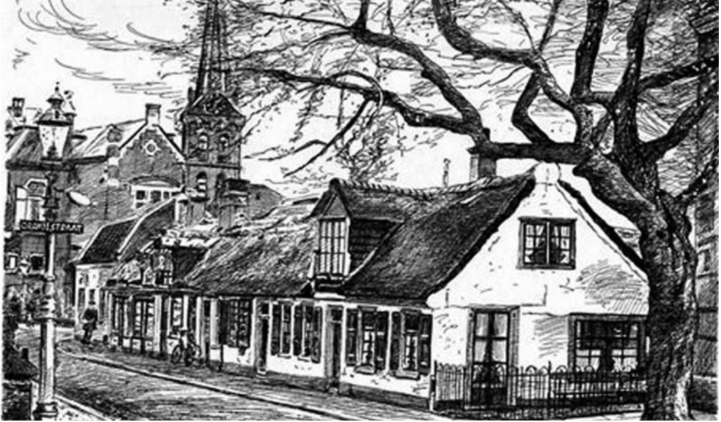
De drie rieten dakjes in de Laanstraat, met erachter het gemeentehuis en de Pauluskerk (1966)