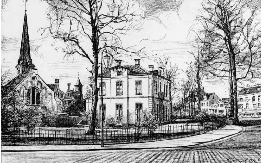
Zicht op de Brink waar nu een groot parkeerterrein is. De Pauluskerk en de voormalige pastorie (1966)

en bij Het Utrechts Archief zijn 9 prenten digitaal aangetroffen die Baarnse dorpsgezichten tonen uit de jaren 1960, de periode voorafgaand aan het rijkelijk hanteren van de sloophamer door de gemeente en projectontwikkelaars. Gelukkig maar dat Jan het voor ons heeft vastgelegd, zo kunnen we nog eens wegdromen en verzuchten hoe jammer het is dat veel van al dat moois verdwenen is.