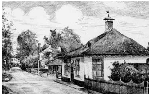
Het oude tolhuisje op de hoek van de Eemweg en de Kerkstraat (1966)