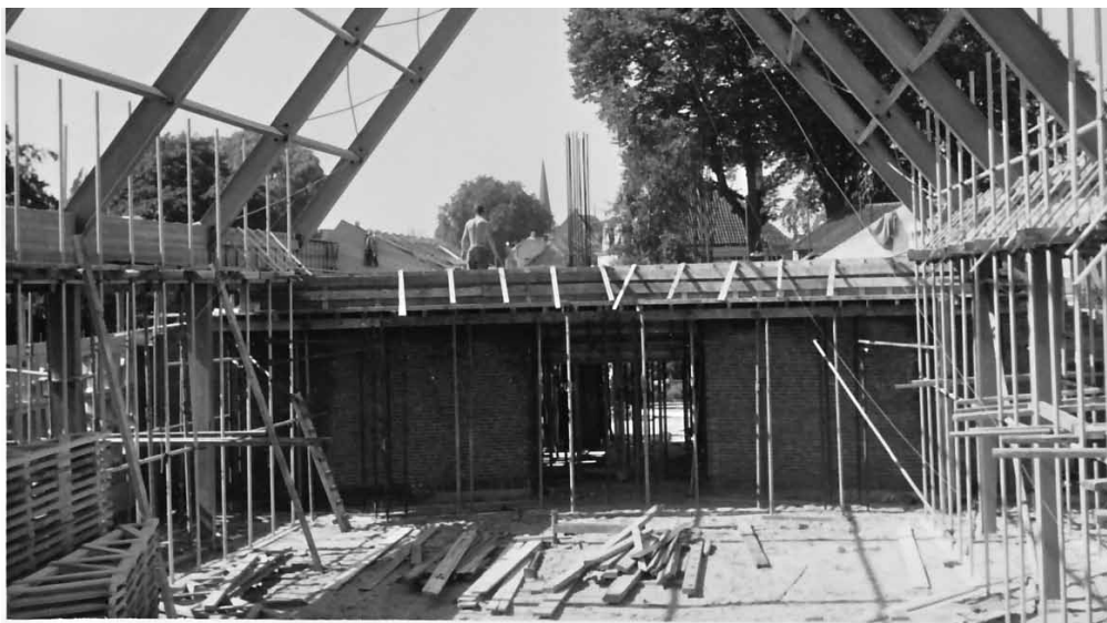
De bouw van de Wederopstandingskerk aan de Eemweg (1964)

Mocht u nog mooie interieurfoto's van Baarnse kerken in uw bezit hebben of andere interessante formatie kunnen bieden, neem dan contact met ons op via T (035) 54 32 666 of oudenalderr@casema.nl . U mag natuurlijk ook met uw materiaal een keer langskomen in de Oudheidkamer onder de Baarnse bibliotheek op woensdag 14.00-16.00 u of zaterdag 11.00-13.00 u.