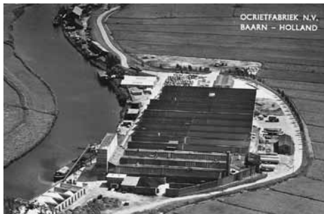
De indrukwekkende Ocrietfabriek in 1958, gezien vanuit het noorden

Ten noorden van Eembrugge, net over de gemeentegrens met Baarn, staan dan