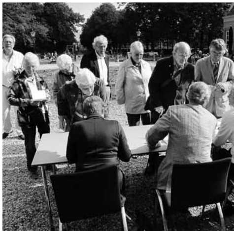
Ontvangst bij het bordes

Kasteel Groeneveld lag er prachtig bij, het terras bij het Koetshuis zat vol met genietende wandelaars, pasgetrouwde paartjes werden in de kasteeltuin aan de lopende band vastgelegd en de feestballonnen van de HKB wiebelden vrolijk aan het kasteelhek. De gasten werden bij het bordes buiten ontvangen en voorzitter