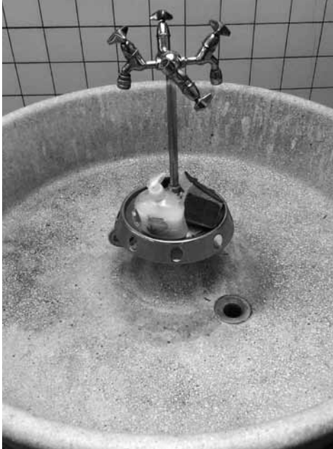
De wasfontein bij Drukkerij Bakker Baarn