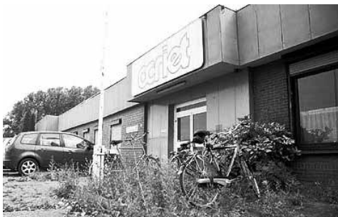
De fabriek in 2007

Verscheidene malen komt het Ocrietterrein negatief in het nieuws door brandstichting en inbraken. Het leegstaande complex raakt in verval en is allang geen visitekaartje meer in de landelijke omgeving van Eemnes en Baarn. Omwonenden vertrouwen de locatie niet, want het asbest kan nog steeds ontsnappen. Bovendien kunnen tijdens een brand met wind uit het noordoosten de asbestdeeltjes ook nog op Baarns grondgebied terecht komen.