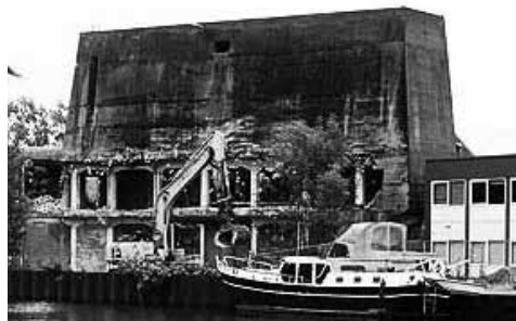
De grote silo na de brand in 2014