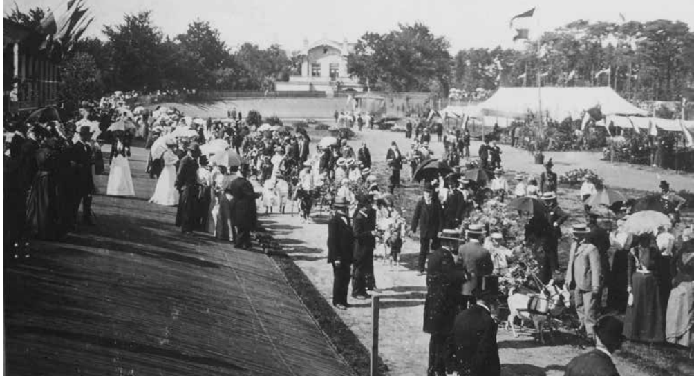
De wielervebaan in het Wilhelminapark tijdens een bloemencorso

baan gebruikt als instructiebaan om te leren fietsen. Het was vooral voor dames in die tijd gebruikelijk dat zij op een besloten terrein de eerste beginselen leerden, niet alleen uit het oogpunt van veiligheid, maar zeker ook van zedelijkheid. Al te onbescheiden blikken van mannelijke 'bewonderaars' werden niet op prijs gesteld. Waar bijvoorbeeld in Amersfoort de plaatselijke wielerscholen door hoge schuttingen omgeven waren, 7 deed men in Baarn niet moeilijk: vanuit het café-restaurant had men een vrij uitzicht: Ter informatie van de wandelaars naar het Wilhelminapark diene, dat de tweede etage met balcon van het Café-Restaurant vrij toegankelijk is. Alleen gedurende wielervedstrijden wordt daar een kleine entree geheven, onder gewone omstandigheden dus niet en dan heeft men er een gezellig