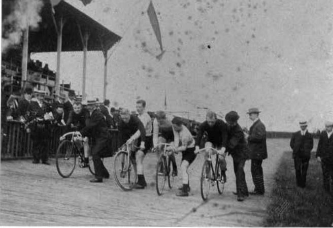
De wielersbaan van Breda (1902-1904)

Een houten baan als die in Baarn was geen onroerend goed, maar roerend goed dat alleen werd opgebouwd wanneer er voldoende animo voor was. Ook in grote steden als Amsterdam, Utrecht en Den Haag (lees: Scheveningen) was een wielersbaan die soms een of meerdere jaren niet uit de opslag kwam bij gebrek aan belangstelling. Dat de baan van Baarn op een gegeven moment verkocht werd, moet men dus niet te snel als een teken van mislukking zien; beter is het om uit te gaan van een commerciële transactie: men verwachtte dat de baan in een stad als Breda – in het zuiden van het land, waar de belangstelling voor de wielersport groter was – meer zou opbrengen dan in het luxe villadorp Baarn. Dat neemt niet weg dat het sportief gezien na 1898 moeilijke tijden waren voor de baansport in Nederland. Ondanks mooie wedstrijden met nationale en internationale toppers, ook in Baarn, was