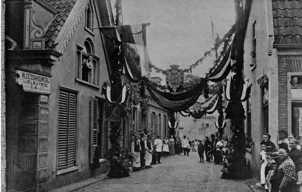
De Nijverheidstraat tijdens een feestdag, rond 1900, met het uithangbord van Frese (coll. HKB)