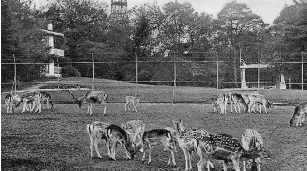
Het hertenkamp met links de theekoepel, middenachter de uitzichttoren en rechts de muziektent

Brink was in de oorlog naar het bosje van IJsendijk verplaatst en daar werden door de bevrijders, vooral Canadezen, uitbundige muziekkavonden georganiseerd.