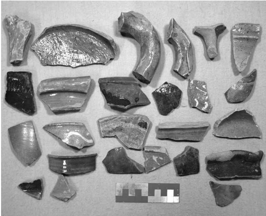
Foto 3 - een groep aardewerkscherven die in 2013 of 2014 zijn geschonken.