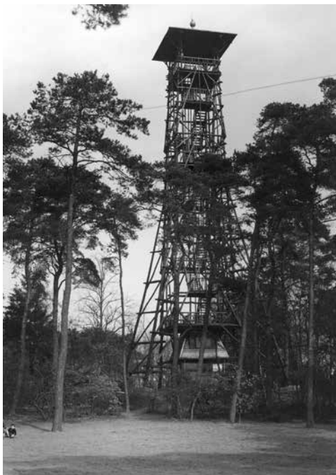
De uitkijktoren in volle glorie

Bij ons zoeken naar werkverschaffingsobjecten zijn wij tot de overtuiging gekomen, dat hiervoor bijzonder geëigend zou zijn het oprichten van een eenvoudigen rustieken uitzichttoren op het hoogste punt van het Maarschalkerbosch. Na ons ervan te hebben overtuigd dat de erfgenamen van