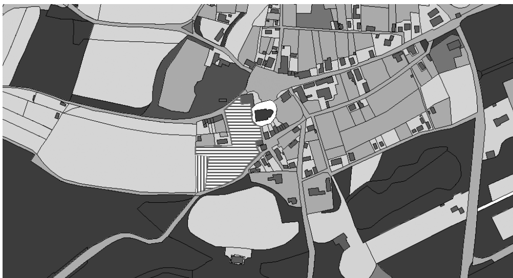
Kadasterkaart 1832 – de gestreepte kavels zijn het grondbezit van Mes Délices , dat zich ook nog uitstrekte naar het westen met het grote rechthoekige perceel ( hisgis.nl )

Nog in 1834 kocht mevrouw Six hier grond aan waarmee het terrein achter het herenhuis werd vergroot. Zo was de toestand van Mes Délices en omgeving, wanneer mevrouw Six met haar twee dochters in de zomermaanden naar Baarn kwam. Op 8 september 1830