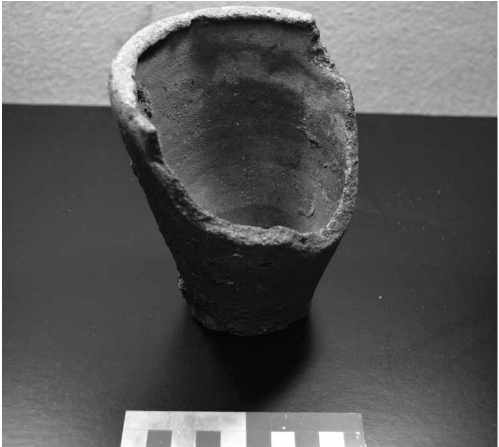
Foto 1 - een gesinterde pot van grijs aardewerk, waarschijnlijk in 2005 geschonken.

ten worden. Om deze gegevens alsnog te kunnen invullen toont de ARWE bij dit artikel foto's van een drietal schenkingen in de hoop dat de schenkers zich alsnog melden met aanvullende informatie. U kunt dan contact opnemen met de coördinator van de ARWE: Jan van der Laan, T (035) 54 116 56.