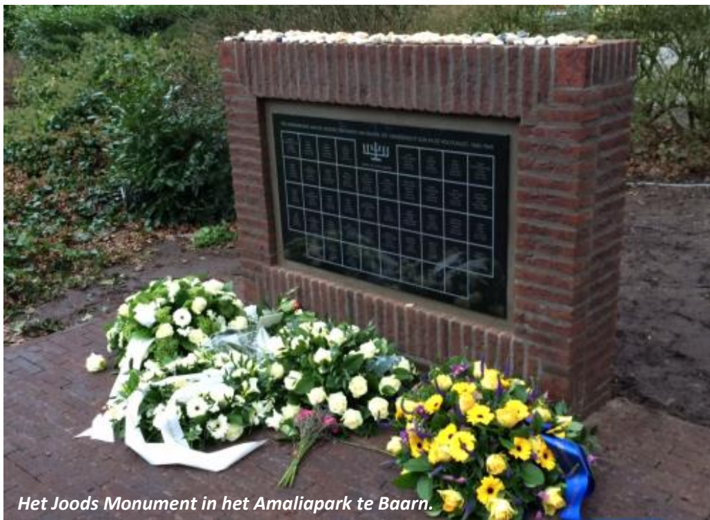
Het Joods Monument in het Amaliapark te Baarn.

Het Comité 4 en 5 mei is een inzamelingsactie gestart om alle 45 Baarnse Holocaust-slachtoffers te adopteren en probeert een bedrag van 45 maal 50 is € 2250 p te halen. Meer informatie vindt u op https://www.holocaustnamenmonument.nl/nl/home/