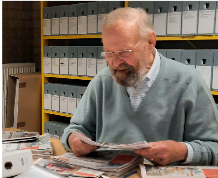
Foto-Filmpresentatie 'BAARN TOEN EN NU'