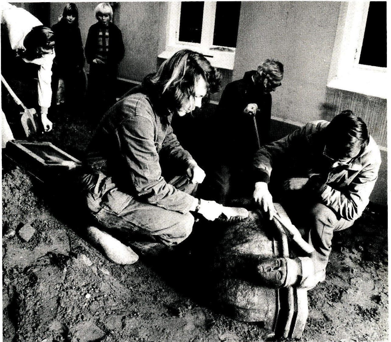
Vondst Doopvont 1975.