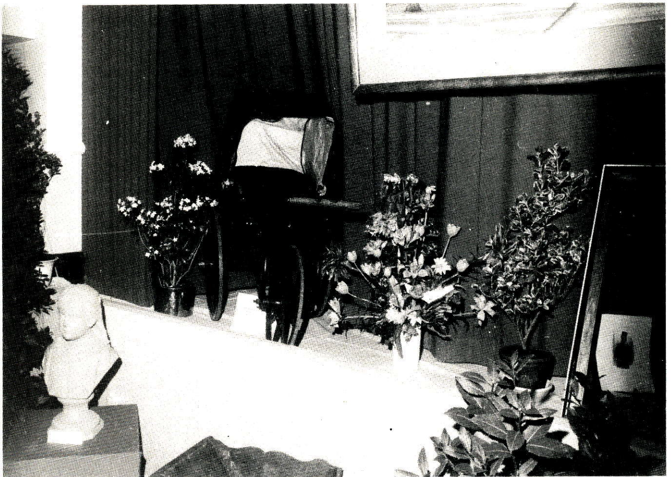
Kinderwagen H.K.H.Prinses Anna Paulowna 1977