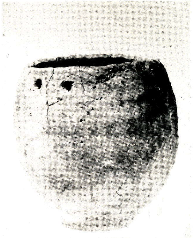
Vondst Urn 1979.