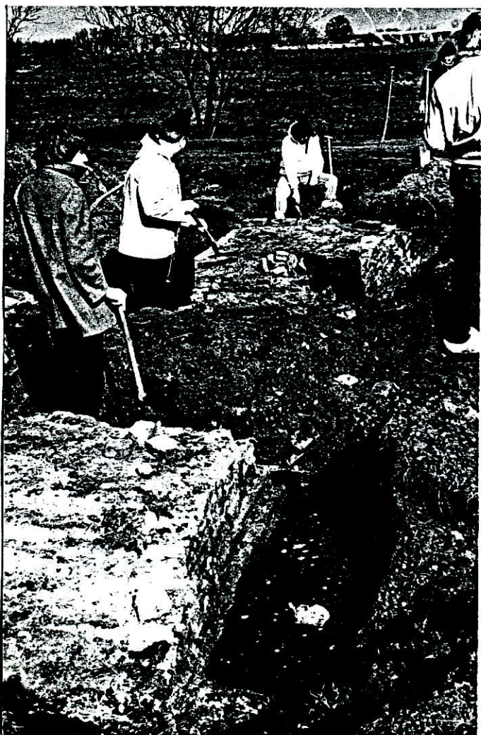
De fundamenten van de molen aan de Eem worden door leden van de A.R.W.E. opgegraven. Mrt. 1980.