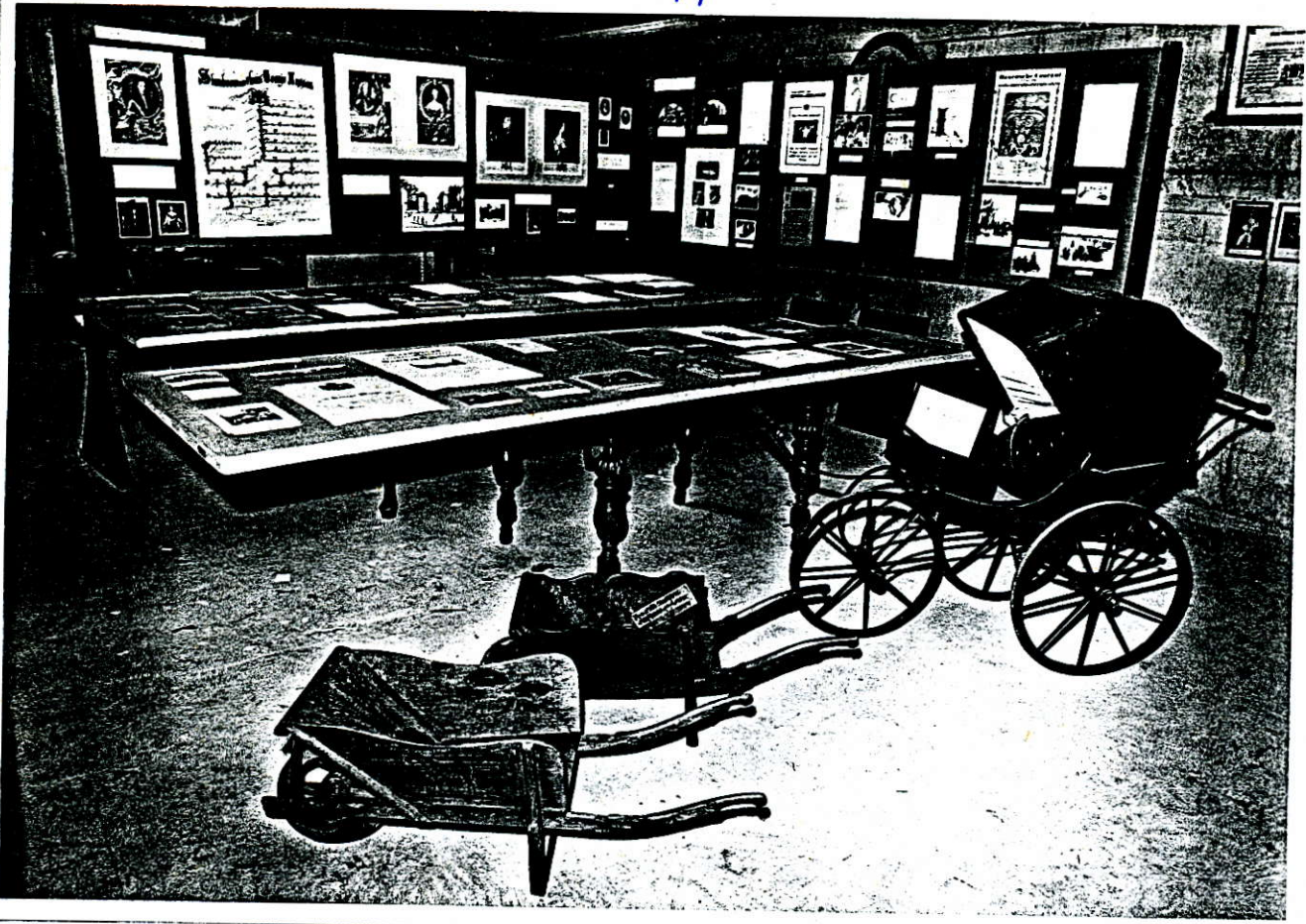
Vorbereiding in de kelder van de tentoonstelling 40 jr. Oranje-Baarn. Apr. 1977. Rechts de kinderwagen van prinses Anna Paulowna