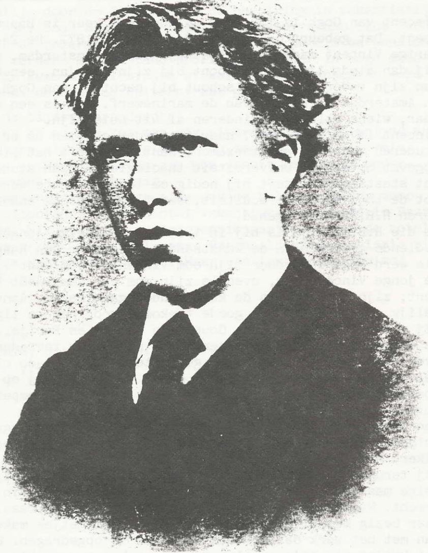
Vincent van Gogh ca. 1872