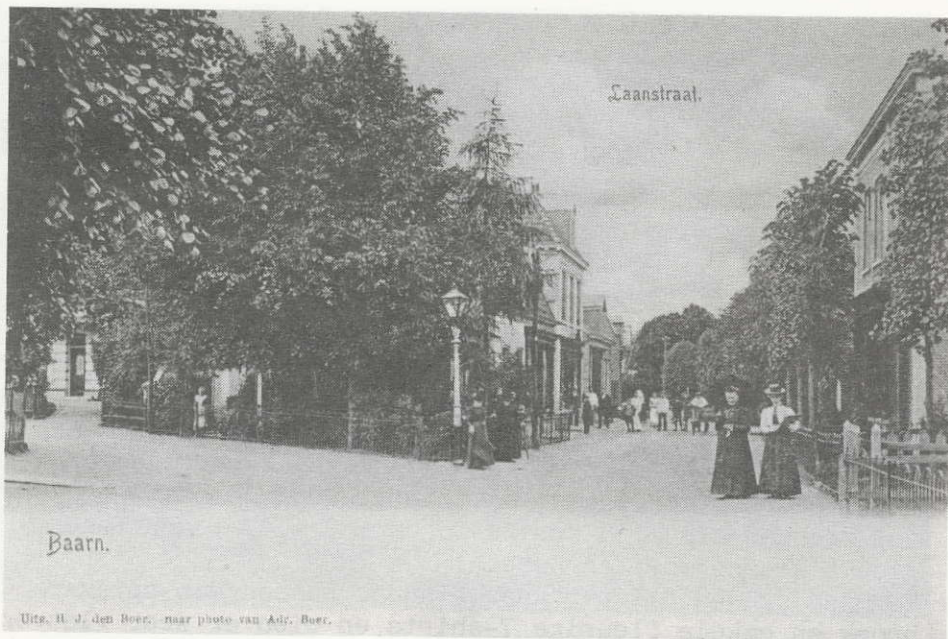
Uits. H. J. den Boer, naar photo van A. C. Boer.

De winkel van de dames Lagerwey, hoek Laanstraat/Spoorstraat.