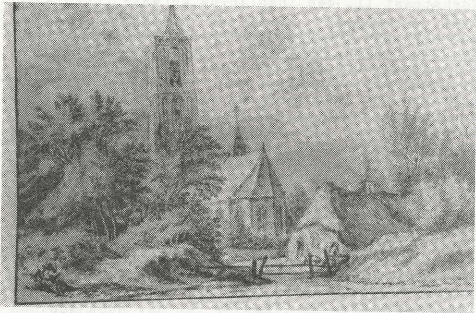
Tekening door Guilleam Du Bois uit 1652