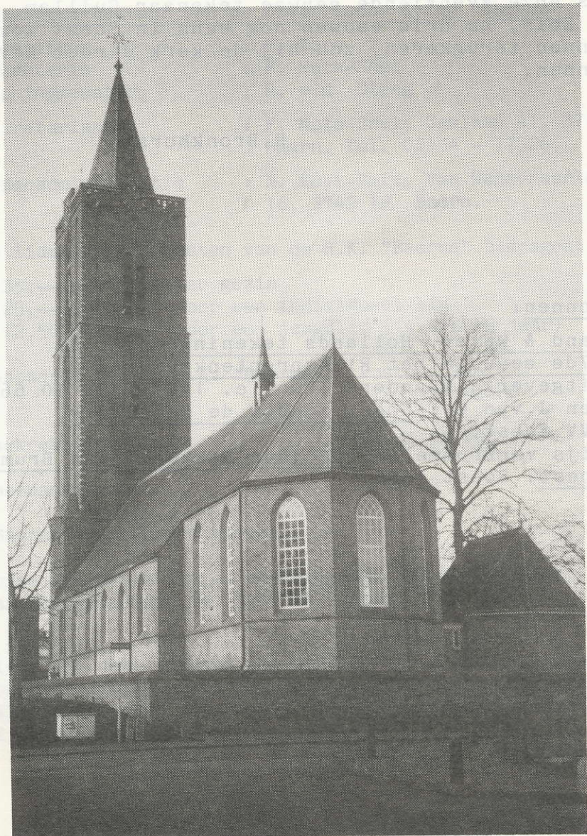
van de Oude Kerk van Soest.