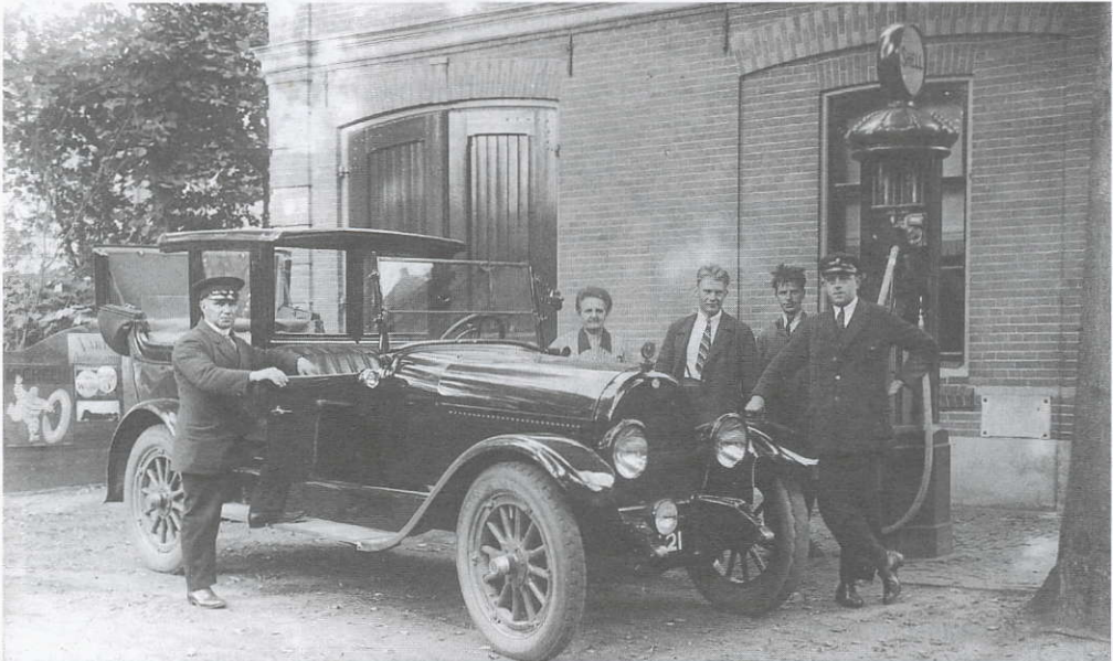
Grootvader, de chauffeur met pet, voor de Minerva met open kap. De auto staat voor de 'Parkgarage'. Erachter staan grootmoeder, werkplaatspersoneel en een chauffeur de heer Nobels. Links van de auto op de schutting: Het Michelin-bandenmannetje en reclame voor 'Varta-accu's'. Let op de benzinepomp.

Er werd goed verdiend aan de stal-klienten en zo bouwde grootvader zijn bedrijf uit