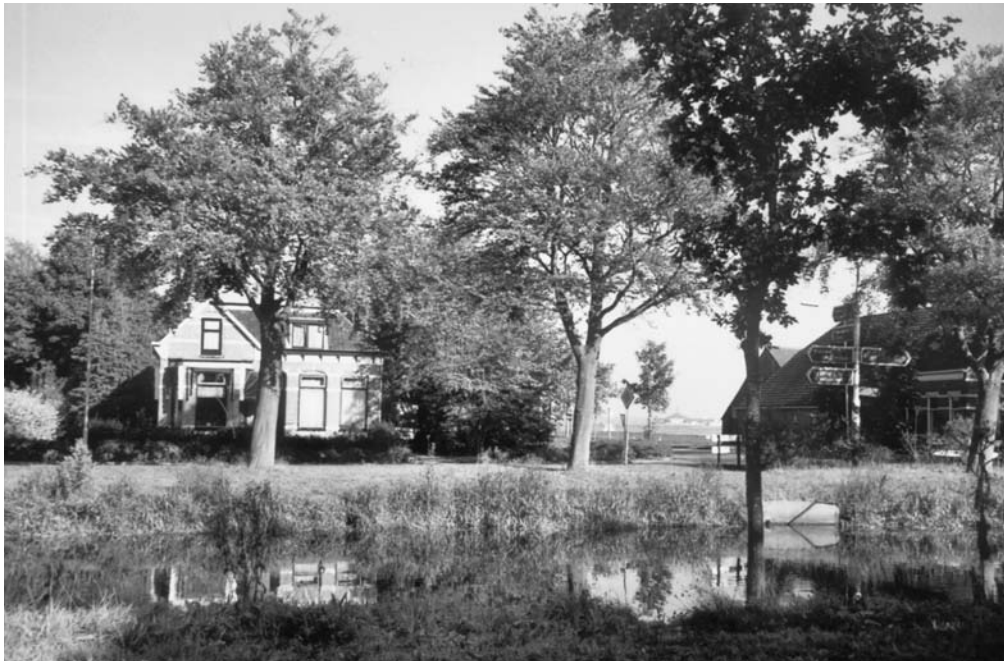
We kijken naar het noorden, richting Emmen. Hier staken de leerlingen van Het Baarnsch Lyceum op 28 november 1930 de Verlengde Hoogeveense Vaart over voor de opening van de school. De pijlers van de voormalige brug zijn nog aanwezig (foto Jaap Kruidenier, oktober 2005)

van de eene plaats naar de andere zijn in Drenthe erg groot. Steeds maar reden we langs eindeloos lange, rechte wegen, die weer langs oneindig lange, rechte vaarten gelegd zijn. Kleine, roode arbeidershuisjes staan op groote afstanden van elkaar langs de weg, en wanneer we aan weerskanten 't land inkeken, zagen we steeds maar dezelfde, grijs-bruine velden, zonder boomen, waarop evenwijdig aan de weg, en even rechtlignig als alles daar is, zwarte langwerpige turfmuren waren opgesta-