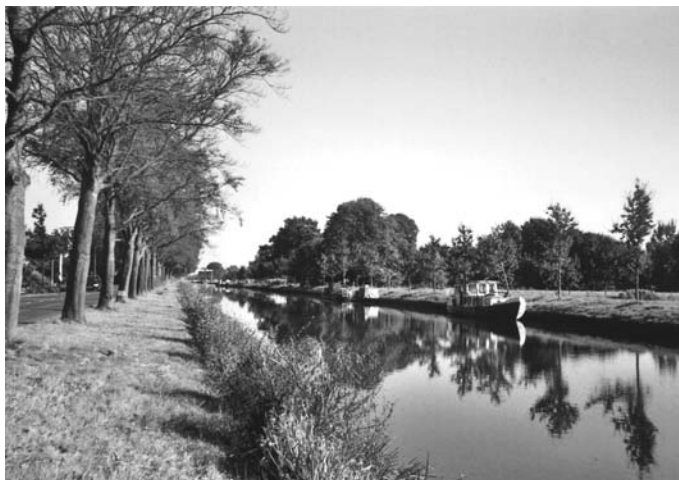
De Verlengde Hoogeveense Vaart in Nieuw-Amsterdam. We kijken naar het oosten, richting Erica. Op het weiland aan de overkant bevond zich tot 1960 het kleuterschooltje (foto Jaap Kruidenier, oktober 2005)

‘Bij het tweede station waren we allemaal schor, en toch moeten we in het gewone doen wel eens meer lachen, maar blijkbaar niet in die mate, als het hier het geval was.