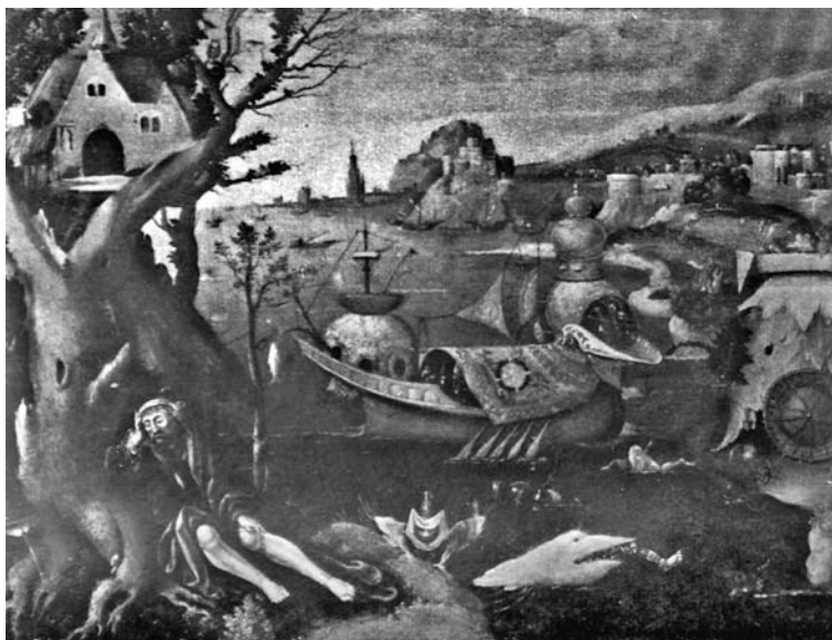
'De Droom van de Heilige Jacobus de Meerdere', door Jeroen Bosch (pagina uit de catalogus van de tentoonstelling 'Baarnse Kunstbezit'. Particuliere collectie)

'Plaatsgenoot en vreemdeling zullen zeker verbaasd staan over de kunst-