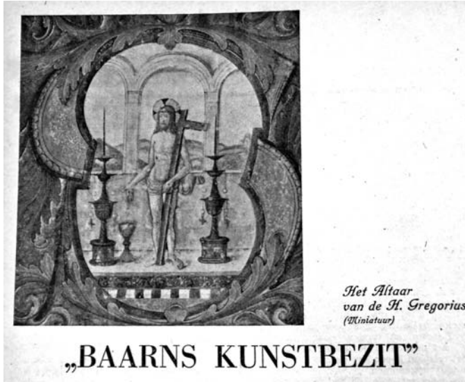
Pagina uit de catalogus van de tentoonstelling 'Baarns Kunstbezit' (particuliere collectie)