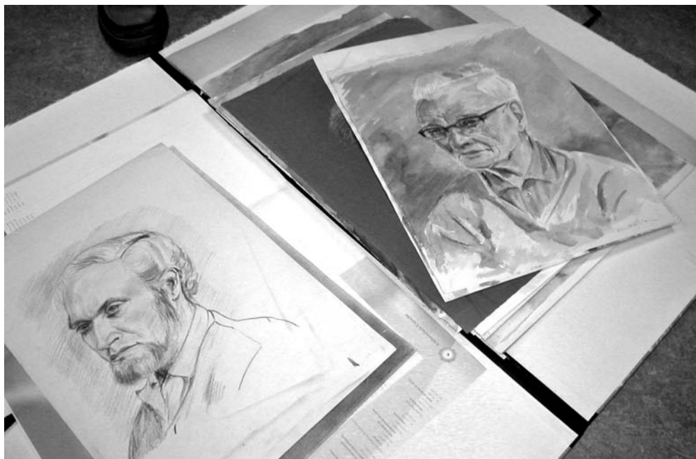
Twee van de aangeboden tekeningen van Gerard de Vries

Gerard de Vries was lid van "De Eemstreek", de kunstenaarsvereniging die in de jaren '40 en '50 in Baarn en in Soest actief was. Ook maakte hij, vrijwel vanaf de oprichting in de zomer van