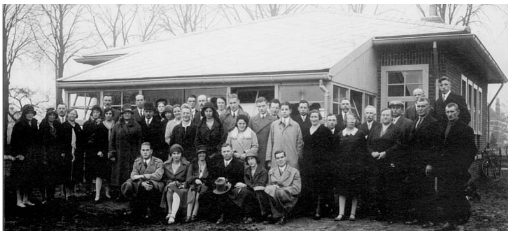
Opening van de kleuterschool op 28 november 1930