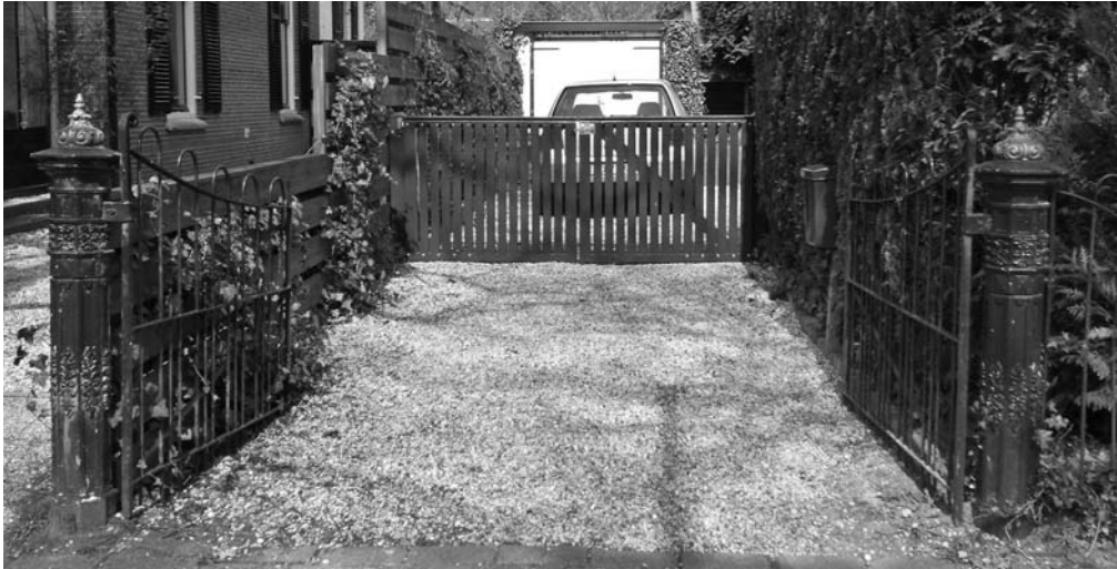
De hekvleugels en – stijlen die oorspronkelijk de tuin en ingang van het Incrementum aan de Amalialaan sierden. Nu staan zij aan weerszijden van de ingang van het huis Nassaulaan 26

met een e-mail (die wij met haar toestemming hieronder opnemen):