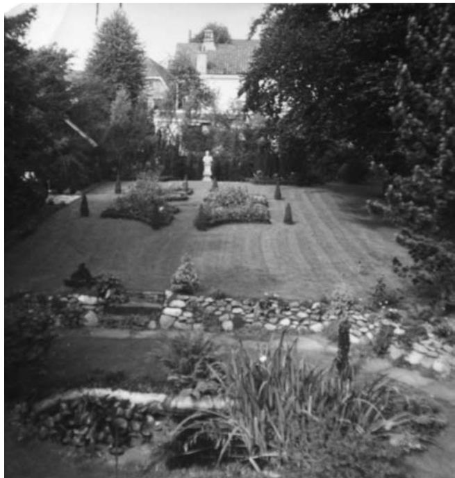
De achtertuin van Mollerusstraat 3, circa 1940