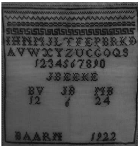
Een van de op de tentoonstelling getoonde merklappen