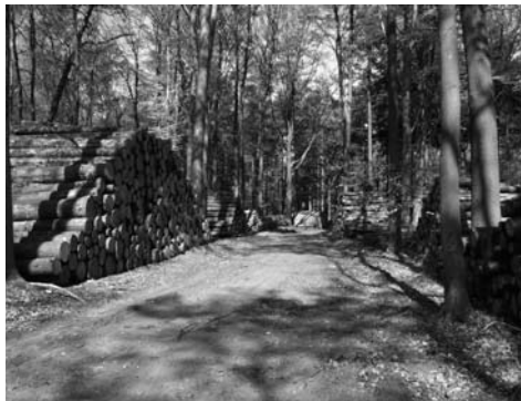
Houtkap in het Baarnse Bos (foto Gerard Brouwer april 2007)

vraag is natuurlijk of dat op dezelfde wijze moet worden voortgezet als de manier waarop dat in 2007 gebeurde.