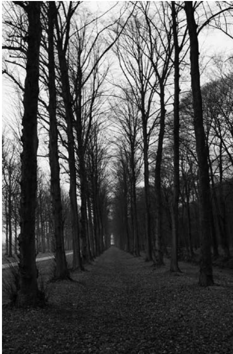
Het Baarnse Bos in de herfst van 2007

te maken, oude stijlenmerken terug te brengen zodat het Baarnse Bos nog duidelijker een vorstelijk wandelpark wordt.'