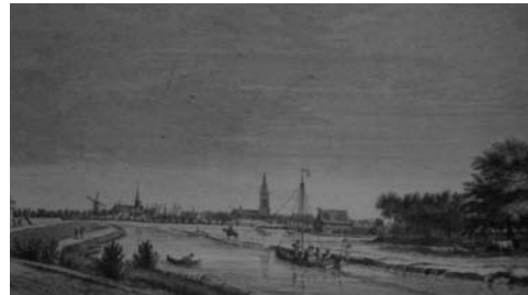
Gezicht op de Eem vanuit het noordwesten in de richting van Amersfoort met de trekschuit en het jaagpad waarop het paard loopt op de Soester oever. Gravure van Jan de Beyer, 1756 (ill. uit besproken boek)

Dat Amersfoort het nog benauwd kreeg met dat moeras, kwam doordat men bij Renswoude zoveel turf afgroef, dat de natuurlijke waterscheiding tussen de Rijn en het moeras verdween en de stad het toegevoerde water niet meer kwijt kon, zeker niet als de Grebbedijk ooit nog eens zou doorbreken.