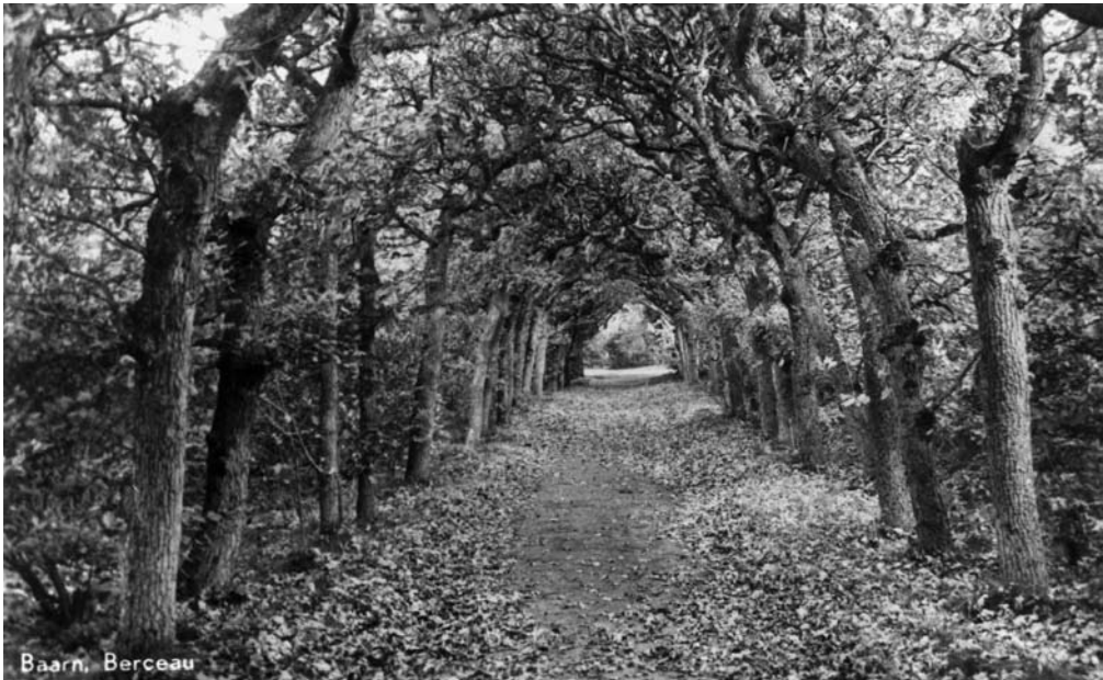
Berceau in het Baarnse Bos