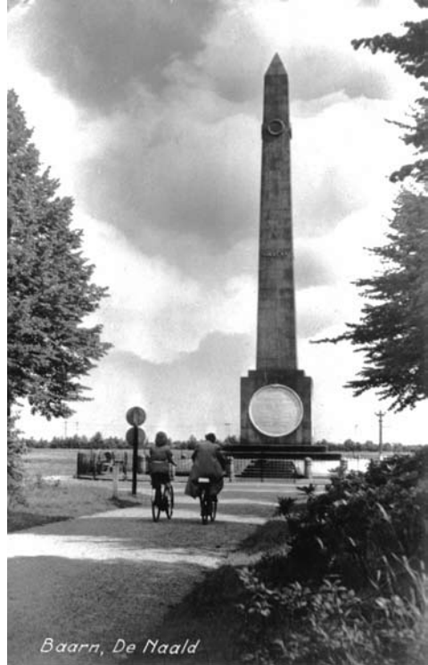
Monument 'De Naald', Torenlaan 19b

aanleiding geeft tot een gezamenlijk protest hiertegen, maar het had toch nogal wat consequenties.