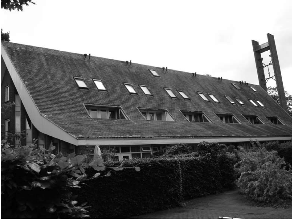
De voormalige Opstandingskerk, nu Ruysdaelhof waar veertien appartementen in zijn gevestigd