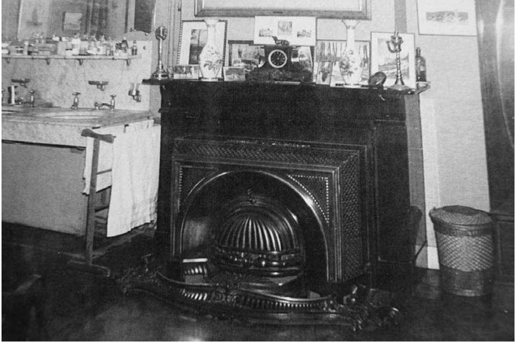
Afb. 1: De dubbele wastafel (links van de haard) stond vol met spullen. Rechts met die van de barones en links met die van de al overleden baron