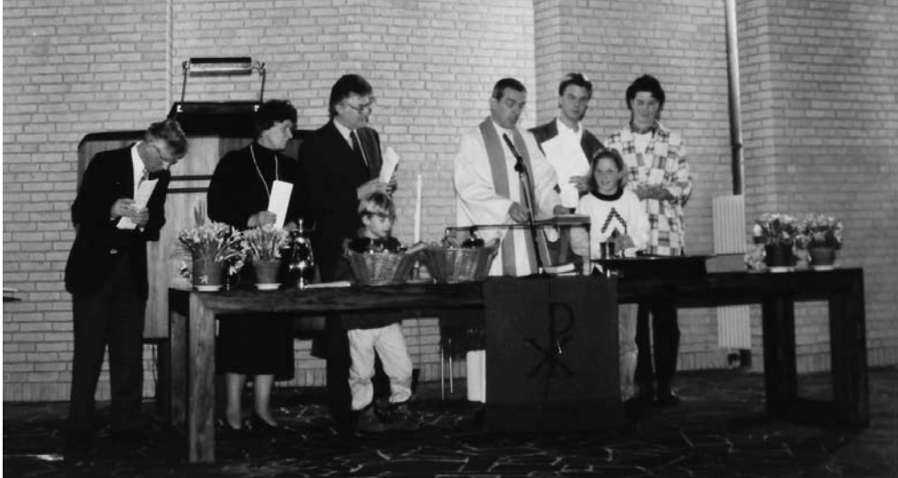
De laatste kerkdienst in de Opstandingskerk

hield de kerk bij de tijd, al gaat het te ver om van een studentengemeente te spreken. Daarvoor was de gevestigde orde te groot.