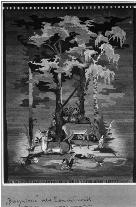
Wandtapijt 'Bossynthese', een ontwerp van Edmond de Cneudt. Van dit ontwerp zijn in 1943 drie -bijna identieke- wandtapijten geweven

Het onderzoek naar de handweverij en tapijtknoperij Edmond de Cneudt (ofwel de weverij) was een logisch vervolg op mijn artikel over de kunstschilder en graficus Cuno van den Steene, dat verscheen in het tijdschrift Baerne . Van den Steene ontwierp namelijk een dertigtal wandtapijten, die door De Cneudt werden uitgevoerd. De weverij was uit oogpunt van werkgelegenheid voor Baarn en omgeving zeker niet onbelangrijk. In 1948 bijvoorbeeld, telde het bedrijf 43 personeelsleden (op een beroepsbevolking van 5956 mannen en vrouwen volgens de telling van 1947). Daarmee was de weverij in grootte de derde werkgever in de gemeente, na drukkerij en uitgeverij Bosch en Keuning en de metaalindustrie Zilgroba. Bijna een halve eeuw lang bood de weverij werkgelegenheid aan tientallen wevers, knopers en ander personeel.