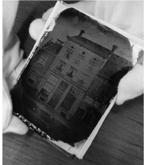
De oudst bekende in Amersfoort gemaakte foto uit 1855

Op de website is met behulp van Google Maps historische informatie toegankelijk gemaakt. Door geschiedenis te