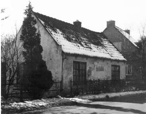
Afb. 2. Huis van het gezin Ravenhorst met 10 (!) kinderen, op Zandvoortscheweg 201

Gijsbertje Bouw, en zijn negen broers en zussen op de Zandvoortscheweg (nu Zandvoortweg) 201 (afb. 2).