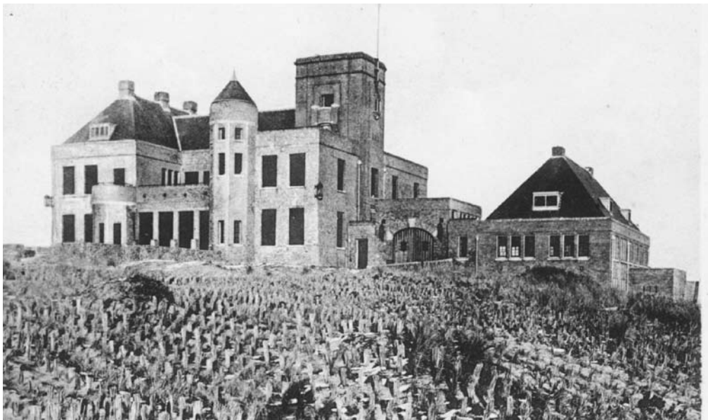
Afb. 7. Villa Russenduin van August Janssen