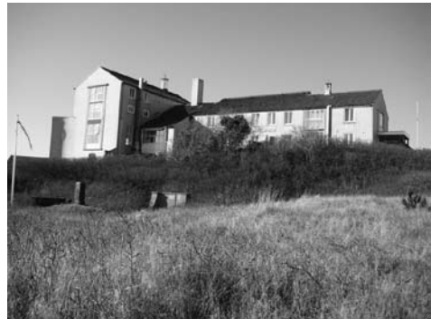
Afb. 8. Het nieuwe Nassau-Bergen