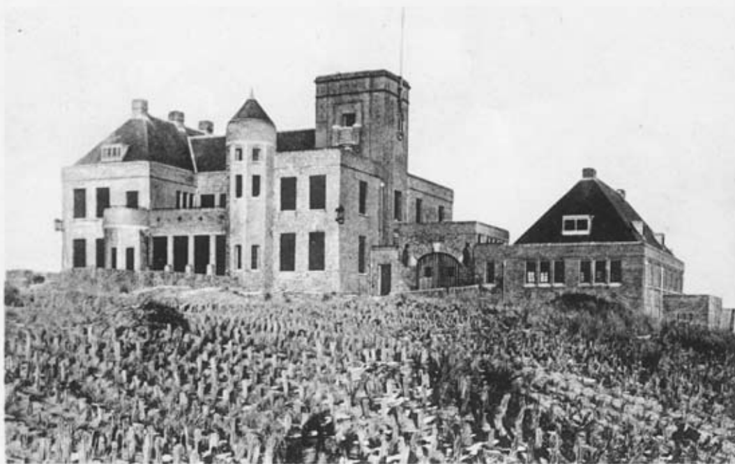
Russenduin, Bergen a/Zee.