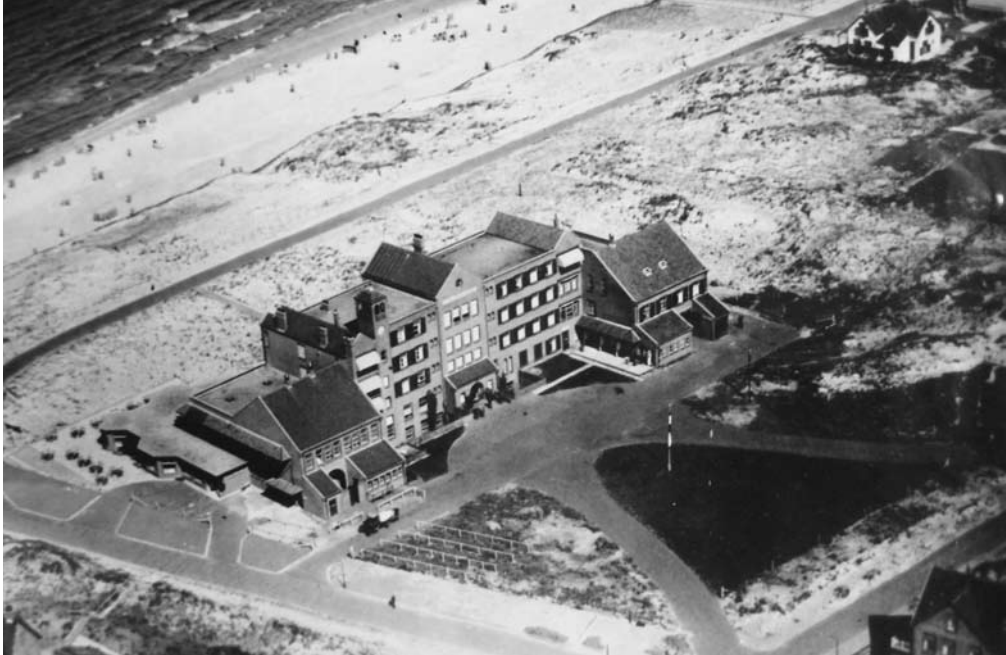
Afb. 6. Hotel Nassau-Bergen (luchtfoto uit 1927)

waar ze een huis hadden laten bouwen. Voor het hotel waren er goede en slechte jaren. In de crisistijd in de jaren dertig hadden ook zij het extra moeilijk, maar steeds hebben ze het hoofd boven water kunnen houden.