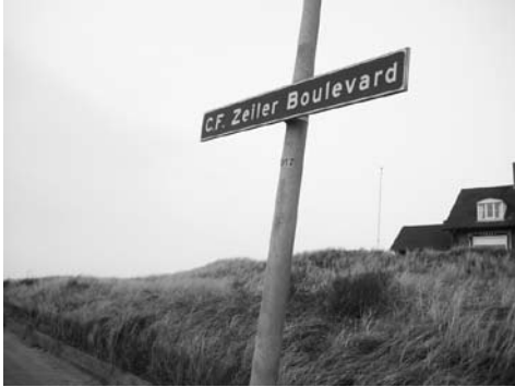
Afb. 9 en 10. Straatnaambordjes