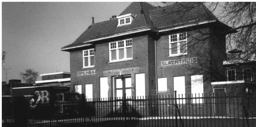
Het slachthuis dichtgetimmerd, wachtend op sloop.