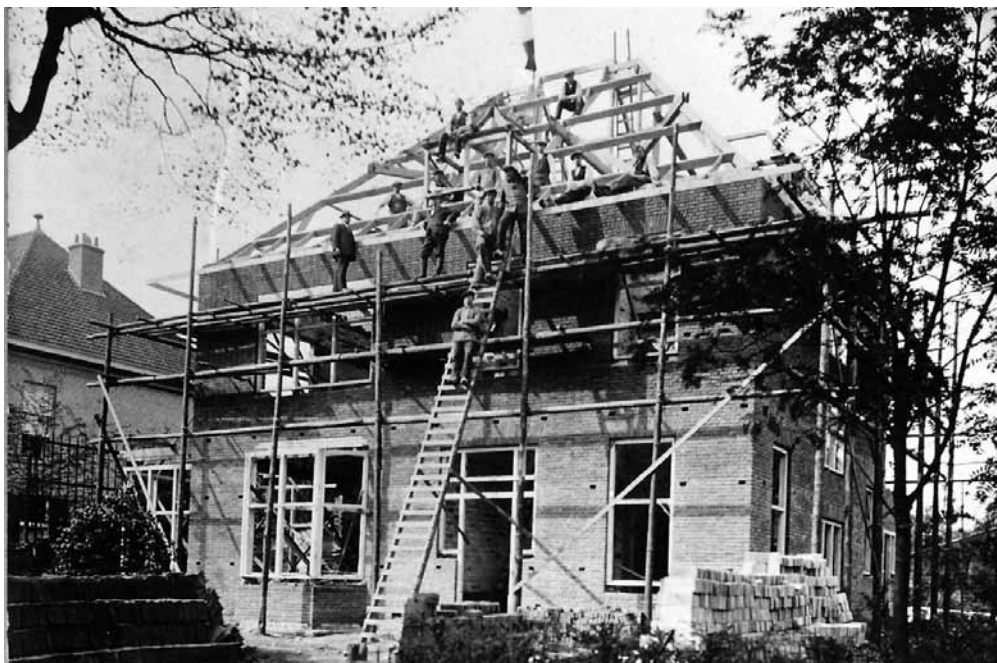
De villa in aanbouw.

Toen de werf 25 jaar bestond, kocht Steven sr. op 1 mei 1902 een stuk grond van 18 are en 80 centiare aan de Oostenburgerdwarstraat, nummers 29