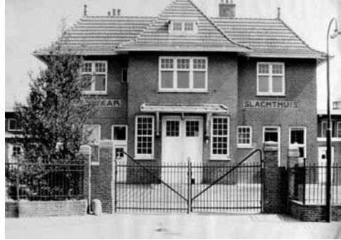
Het slachthuis in betere tijden.

Erg veel slachtingen werden er in de beginjaren nog niet verricht. De eerste vijftien jaar werd er slechts drie middagen per week geslacht. Meer werk was er niet. Dit kwam doordat de gemeente Soest, op instigatie van een paar eigenwijze slagers, haar toegezegde samenwerking in 1922 alsnog introk. De Soester slagers hadden helemaal geen zin in deze over-