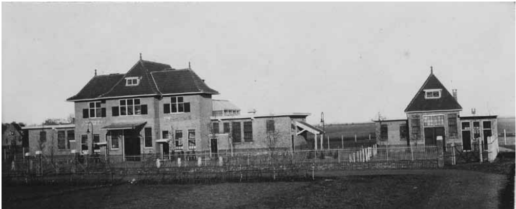
Het slachthuis net buiten de bebouwde kom.

erger. Eind negentiende eeuw lagen de grachten van Amsterdam vol met rot-tend slachtafval en leeggegooide poepdozen. Bij laag water was de inhoud niet alleen te zien en te ruiken, maar ook te voelen. Het waren immers de bacteriënhaarden voor ziekten als tyfus en cholera. Overheden probeerden mensen te dwingen hun dieren op centrale plekken te