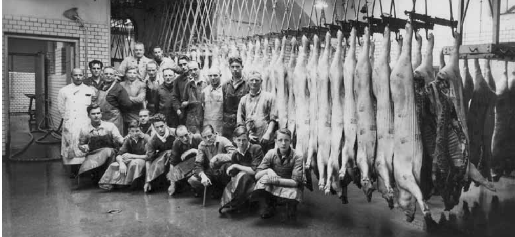
Het voltallige personeel rond 1950.

slachten, maar de openbare slachthuizen bleven schaars in Nederland. Begin twintigste eeuw telden alleen de grote steden Rotterdam, Utrecht, Amsterdam en Den Haag gemeentelijke abattoirs.