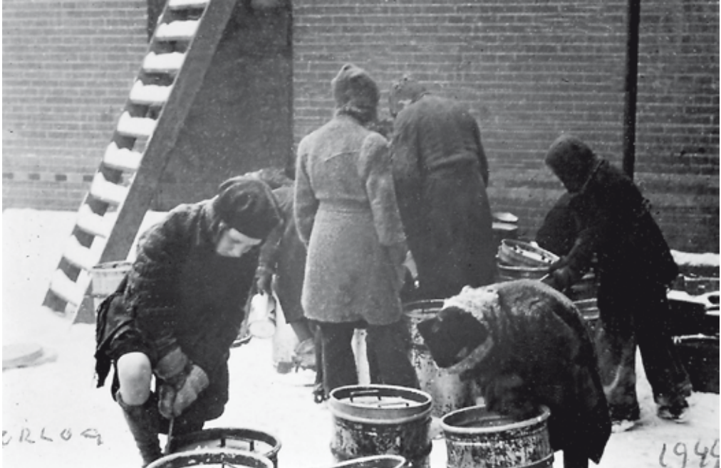
Kinderen bij de gamellen van de Baarnse gaarkeuken, 1944.

de gek er voor geven wil. Kaas niet te krijgen.