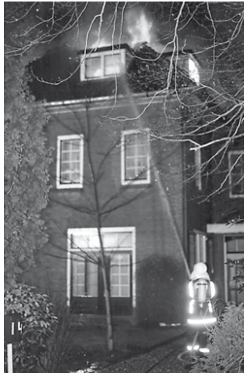
Prins Hendriklaan 14, Het Falckhuis, 8 maart 1988.

Wij verwelkomen u graag op onze tentoonstelling in de Oudheidkamer van de Historische Kring Baerne, gevestigd in de kelder onder de bibliotheek, Hoofdstraat 1a. Onze openingstijden zijn woensdag 14.00-16.00 uur en zaterdag 11.00-13.00 uur. De expositie is te zien van zaterdag 1 maart tot en met eind juni 2014. Voor meer info zie onze website www.historischekringbaerne.nl