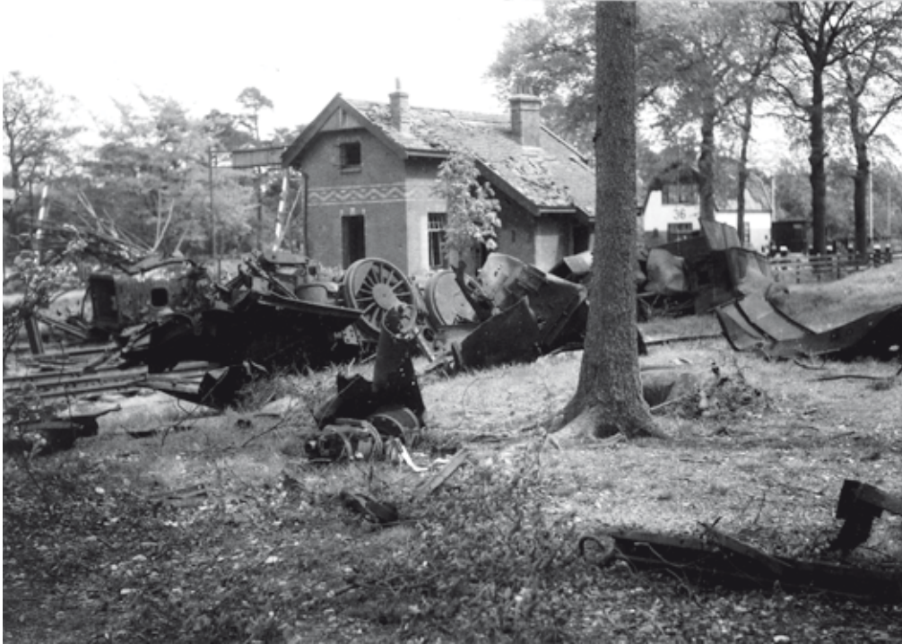
Gebombardeerde paardentram in Amersfoort, 1944.

ben hier in Baarn weer nieuwe troepen gekregen, uit Estland en vele vluchtelingen. Telkens komen er weer aanvragen, maar niemand komt. De inkwartierder Winter begint nattigheid te voelen. De distributie is in Baarn hopeloos in de war. De mensen lijden honger en koude. De cv is niet te stoken. De toestand is verre van aangenaam. Twee jongelui zijn opgepakt en losgebroken, na hun bewaker te hebben neergeslagen en ze zijn ontkomen. Gisteren werd T. v. Dorp 4 aangehouden en opgepikt, maar ze hebben hem toch weer los gekregen.