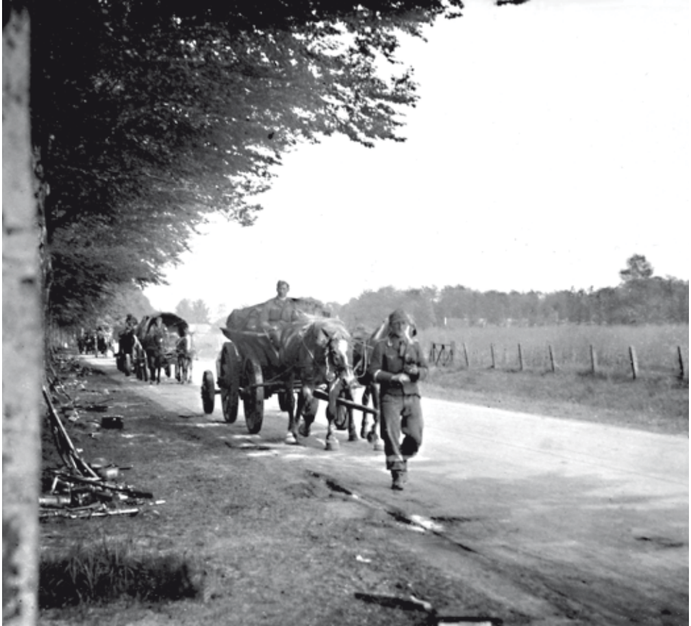
Terugtrekkende Duitse troepen, 1945.

heelen morgen en middag daar bezig om de kamers daar te demonteren met de behanger. De mof is eruit en heeft een onbeschrijfelijke rommel achtergelaten, waaronder ongeveer 200 lege flesschen. Bijna alle sleutels mankeren. In het dorp schijnt ook veel schade te zijn met naar men zegt zes dooden te betreuren.