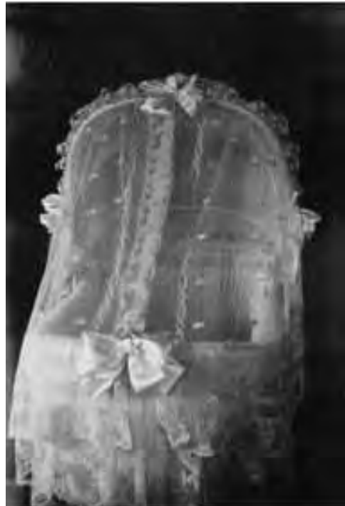
De door het Baarnse depot beklede wieg van prinses Beatrix

Ook tijdens de Tweede Wereldoorlog wordt zo goed en zo kwaad als het gaat hulp geboden aan handwerksters en andere hulpvragers die zich in ellendige omstandigheden bevonden. De schaarste aan textiel en het verbod op arbeidsbemiddeling na 31 december 1941 bemoeilijken echter het bieden van hulp. Overal werden (restjes) wol en textiel verzameld om de handwerksters werk te laten behouden. De depots kunnen tijdens de Tweede Wereldoorlog wel blijven functioneren. Op de vraag