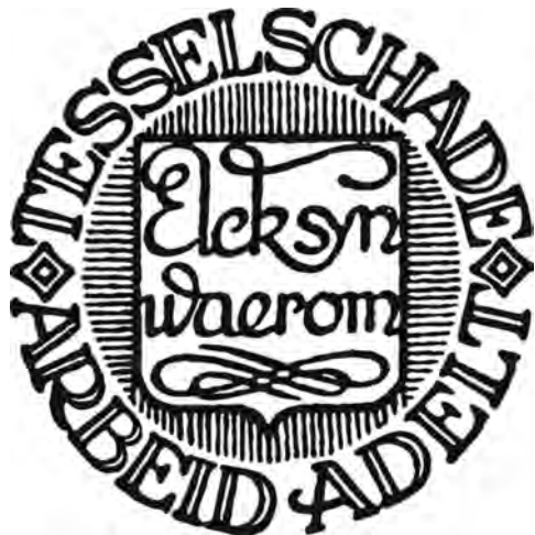
Tesselschade Arbeid Adelt, met het motto 'Elck syn waerom' (coll. TAA, afd. 't Gooi)

In het fusiejaar 1953 was Nederland enorm veranderd in vergelijking met de oprichtingsdatum van de verenigingen: de ontwikkeling van de verzorgingsstaat en het studiefinancieringsstelsel maakten dat er vanaf de jaren '70 weinig financiële belemmeringen waren voor het volgen van opleidingen voor vrouwen. Met de tweede feministische golf konden veel vrouwen zelfstandig worden