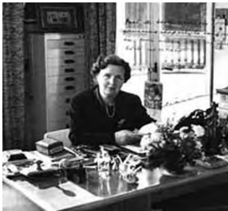
Juliana aan bureau op Soestdijk. Opschrift: 'Met de beste wensen voor uw gemeenschappelijke toekomst en voor allen voor wie uw zorg zich uitstrekt. Juliana.' Hoogstwaarschijnlijk geschreven n.a.v. de hereniging van de verenigingen tot TAA.

die naoorlogse jaren komt daarom het accent van de verenigingen meer te liggen op het bevorderen der vrouwelijke handarbeid, die zoveel poëzie en gezelligheid in onze huizen brengt. De verenigingen lobbyen bij de minister van Onderwijs Cultuur en Wetenschappen om handwerkonderwijs voor meisjes weer in te voeren op lagere scholen. Deze lobby heeft geen succes en ook verder blijkt de overheid (en haar bureaucratische regels) vooral een hinderpaal voor de 'particuliere weldadigheid' van de verenigingen. Hun arbeidsbemiddelingsbureaus mochten na de oorlog weer open, maar ze krijgen te maken met beperkende voorwaarden en geleidelijk aan wordt de arbeidsbemiddeling