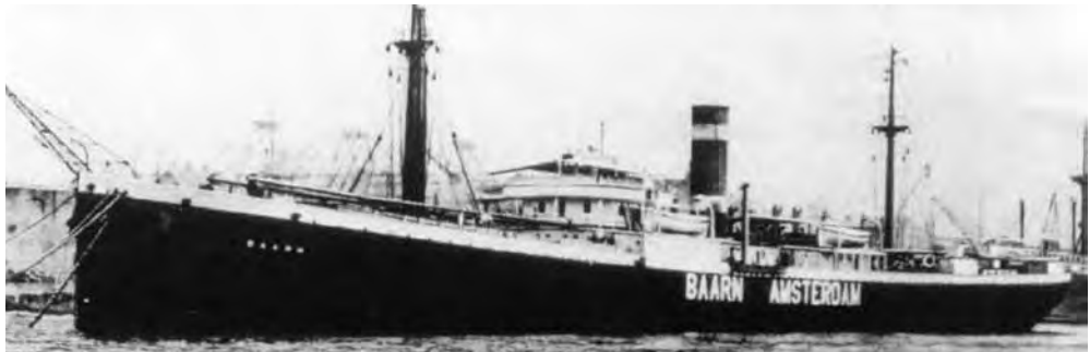
Het ss Baarn in 1920