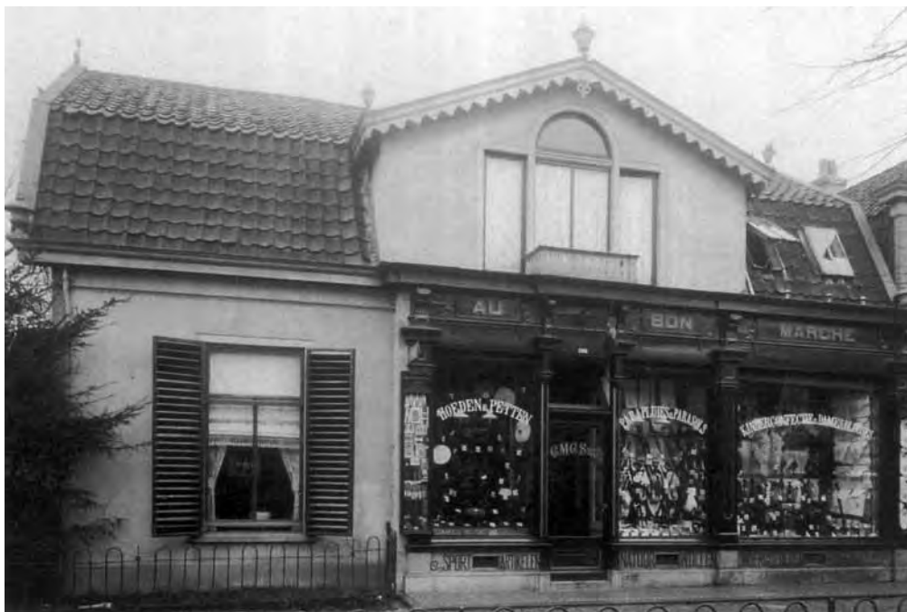
Laanstraat 189: de winkel Au Bon Marché van de dames Middelkoop, aan de Laanstraat 91, waar het Verenigd Dépôt Arbeid Adelt-Tesselschade in 1937 was gevestigd

Het ledental van beide Baarnse afdelingen is in de decennia na de Eerste Wereldoorlog gedaald. Door de hoge werkloosheid neemt echter het aantal hulpvragen toe. Hoewel de verenigingen hulp bieden aan beschaafde dames, dat wil zeggen afkomstig uit gegoede fa-