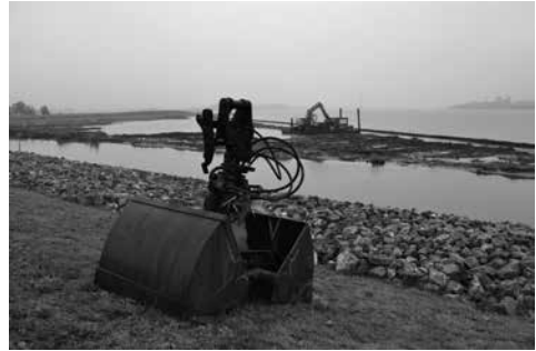
Stortsteen op de Oostdijk en nieuw aangelegd rietveld op de dijk bij Nekkeveld.

Ter compensatie van alle veranderingen langs de Eem is de ontwikkeling van drie nieuwe natuurgebieden bij de werkzaamheden inbegrepen. Het betreft het eiland de Grote Melm, natuurgebied Wolkenberg tussen de Eem en het Zuidereind en natuurgebied Bruggematen tussen de Eemdijk en de Eem. In totaal zal hier 16 ha natuurge-