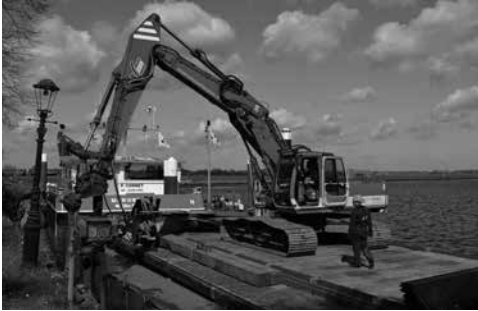
Het vervangen van de houten beschoeiing door stalen damwanden bij de Kleine Melm.

zematten uit WOII ook weer in het zicht gebracht.