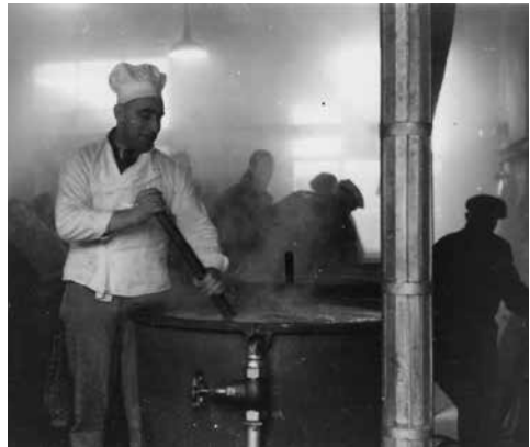
Voedselbereiding in de Centrale Keuken

Bovendien wordt in datzelfde jaar bij de gasfabriek een Centrale Keuken geopend waar men, natuurlijk op de bon, warm eten kon halen.