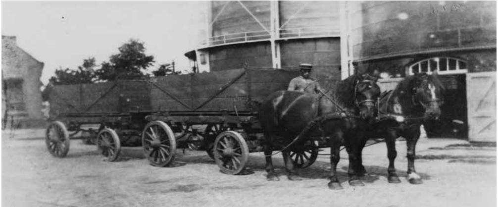
Aanvoer van kolen per paardentactie

sterrein. Maar al snel volgde ook aanvoer over water. Eind december 1931 werd begonnen met de bouw van een bunker met een inhoud van 60 ton aan de Eem. Met deze losplaats waar de kolen uit de schepen gelost werden, konden de (transport)kosten van de kolen verlaagd worden. De kolen werden aanvankelijk per paardentactie dwars door het dorp naar de Gaslaan gebracht. Later volgde een speciale vrachtauto met vijf kiepbakken die onder de bunker doorreed. Het systeem was zo ontworpen dat de bakken in een keer gevuld werden zonder dat de vrachtwagen verplaatst hoefde te worden. Aangekomen bij de gasfabriek parkeerde de vrachtwagen voor de kolenlift: de bakken werden gelost, de lift ging omhoog en de kolen werden gestort in de kolenbunker van de stokerij. Onafgebroken reed de vrachtwagen op en neer tussen de Eem en de Gasfabriek.