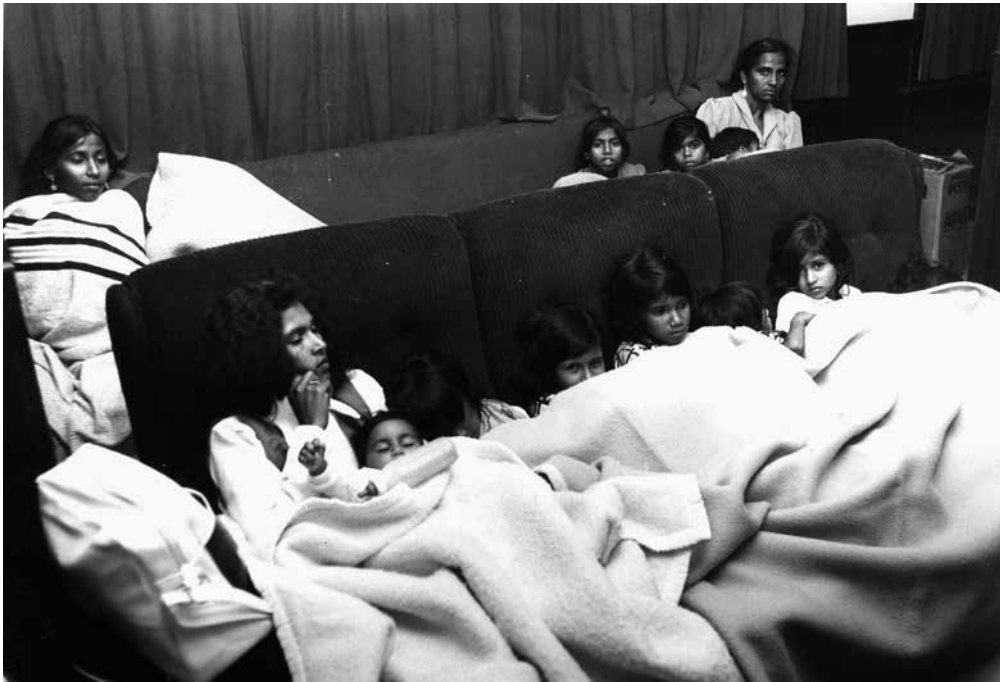
Tijdelijke opvang van Bavo-bewoners in Bussum

Maar zoals te doen gebruikelijk ging ook bij deze opvang niet alles van een leien dakje. Verre van dat. Naast de Baarnse bemoeide ook de landelijke politiek zich met de gemaakte plannen. Er was zelfs nog een kort geding nodig tussen de oorspronkelijke plannenmaker de heer