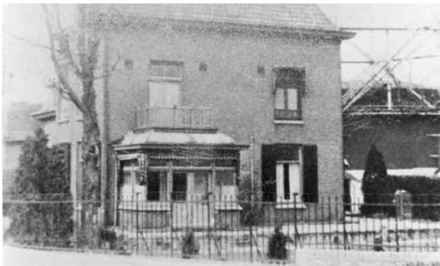
De in 1903 gebouwde directeurswoning

Aanvankelijk werd de steenkool aangevoerd per spoor en naast het huidige restaurant De Generaal gelost, in vrachtauto's overgeladen en vanaf het spoorwegemplacement vervoerd naar het fabriek-