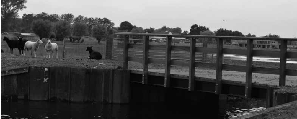
Open waterverbinding tussen de Eem en natuurgebied Wolkenberg.

Grote Melm wel. Daar werd door de beroepsarcheoloog een vuursteencomplex gevonden in de oorspronkelijke situatie. Het complex is na de ontdekking weer afgedekt met grond.