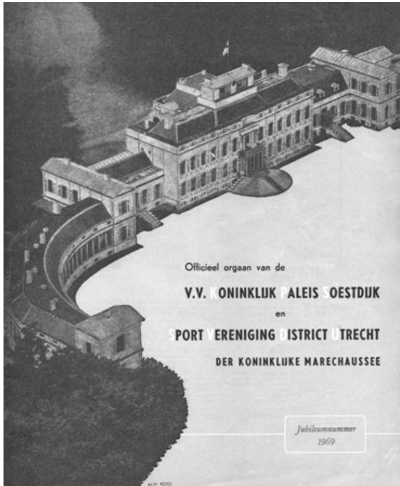
Cover van het KPS-blad ter gelegenheid van het 15-jarig jubileum in 1969.

Op de KPS-jaarvergadering van 1953 werd besloten om over te gaan tot een gezamenlijke uitgave, genaamd 'Officieel orgaan van v.v. Koninklijk Paleis Soestdijk en Sportvereniging District Utrecht der Koninklijke Marechaussee' in de volksmond: de K.P.S.'er . Het eerste nummer verscheen op 30 april 1954, de verjaardag van Juliana.