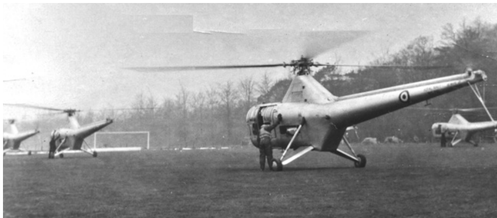
Het voetbalveld als landingsveld.

In de eerste jaren waren in de directe omgeving weinig gelijkwaardige partners te vinden. Op de ledenvergadering in het Oranje Hotel werd in 1949 besloten aan de zomeravondcompetitie (ZAC) deel te nemen. KPS trad met twee elftallen toe tot de KNVB afdeling Utrecht in het district Hilversum en speelde de jaren daarna in de ZAC. Vervolgens werd een ve-