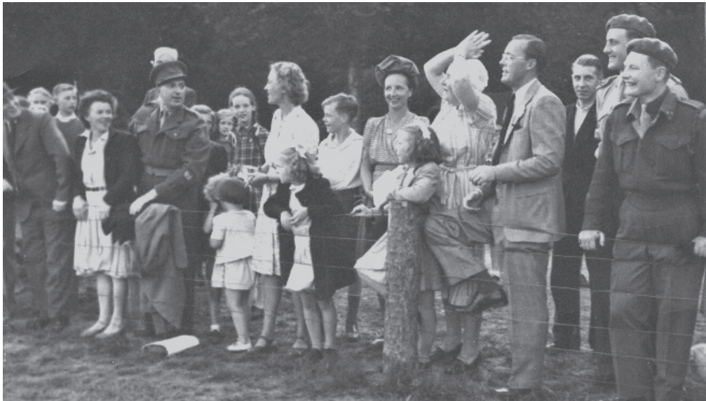
Juni 1946. Het koninklijk gezin met de prinsessen Beatrix, Irene en Margriet volgen met belangstelling de wedstrijd KPS-Staf I.G.K.I.

De eerste wedstrijd in 1947 was tegen het personeel van de Baarnse garage Van der Hoef aan de Amaliaaan. Daarna volgde een duel tegen het personeel van de Staf Inspecteur-Generaal der Koninklijke Landmacht De Zwaluwenberg uit