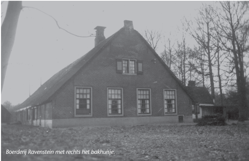
Boerderij Ravenstein met rechts het bakhuisje.

kenbossen. In 1930 zijn mijn ouders getrouwd en mijn moeder gebruikte het bakhuisje ook om er de was te doen en kaas te maken. Toen mijn zus Bep in 1932 werd geboren kwam de eerste Miele wasmachine daar te staan die nog een poos in de tuin heeft gestaan, 'van goed eikenhout gemaakt'.