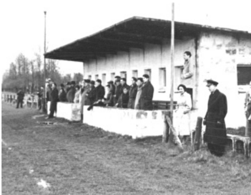
Het clubhuis met tribune.

De officiële opening van het sportterrein was op zaterdag 16 augustus 1947. Twee sterke eerste klasse clubs speelden die dag een erewedstrijd. Na afloop reikte prins Bernhard een beker uit aan de winnaars van de erewedstrijd en van de Nederlaagwedstrijden.