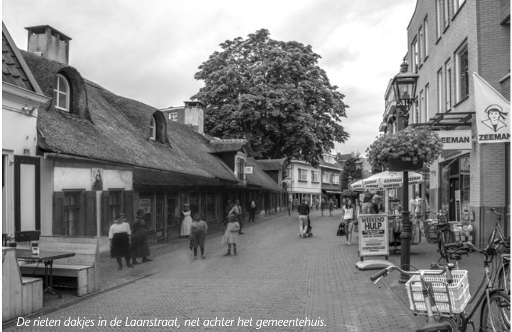
De rieten dakjes in de Laanstraat, net achter het gemeentehuis.