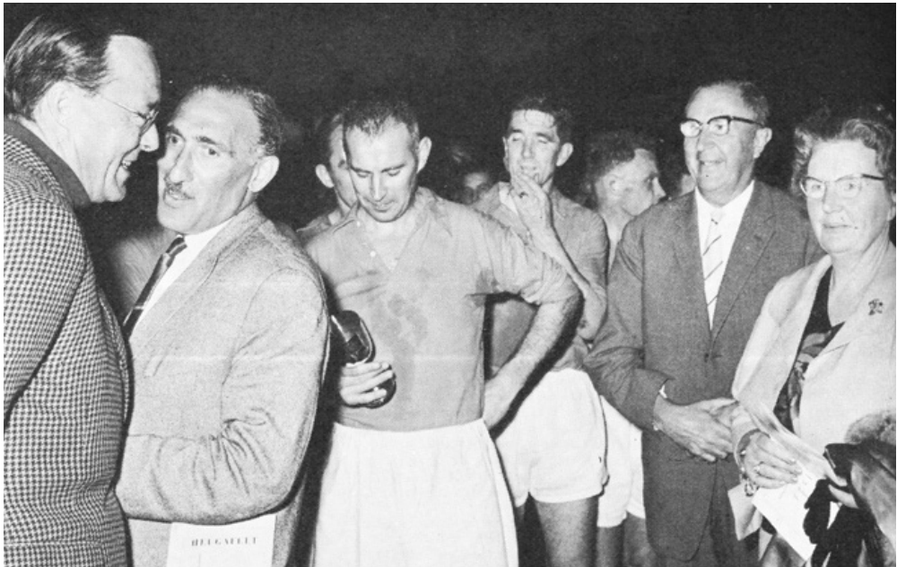
Max Tailleur vertelt zijn nieuwste mop aan prins Bernhard

Nadat de marechaussee in januari 1947 de bewakingstaak van paleis Soestdijk overnam ontstond al gauw een toenadering tussen deze 'paleiswacht' en het personeel van het paleis. Op 7 december 1949 werd de Sport Vereniging dis-