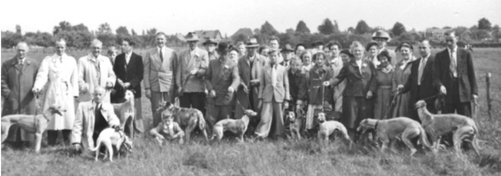
Gezelschap met windhonden tijdens een sportdag.

In 1971 degradeerde KPS na verlies tegen CBB vanuit de eerste klasse waarin altijd werd gespeeld. In 1973 werd door de winst op het bedrijfselftal van Pon uit Amersfoort ternauwernood degradatie naar de derde klasse voorkomen. Door de veroudering van de leden kwam in 1976 echter een eind aan het bestaan van KPS. De leden van de club gingen door als personeelsvereniging onder de naam AA '76, een verwijzing naar het AA-kenteken van de hofauto's.