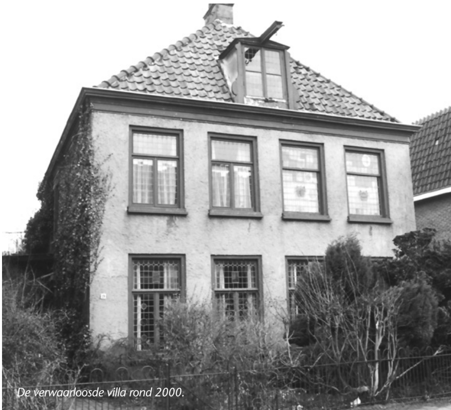
De verwaarloosde villa rond 2000.