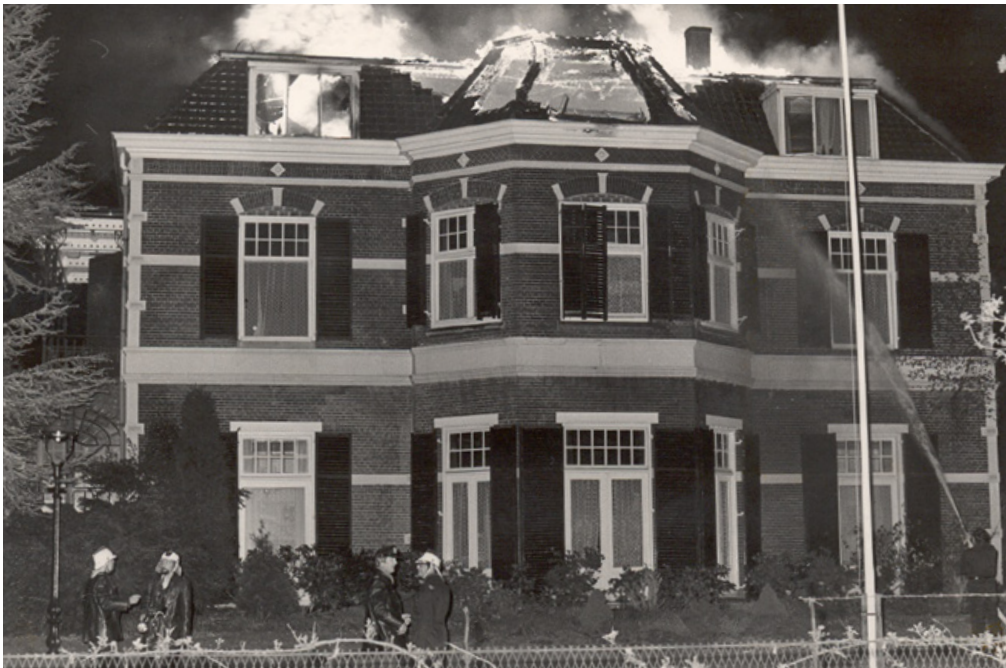
Brand op de bovenverdieping van Hoofdstate, 21 mei 1979

Als Louisa State in 1994 het 125-jarig bestaan van de Louisa Stichting viert, is de terugloop in het aantal kinderen al in gang gezet. Van 70 naar 60 tot 50 pupillen in de jaren '90, zakt het aantal leerlingen tot minder dan veertig aan het begin van de 21e eeuw. Inmiddels is geen enkele pupil nog een kind van vrijmetselaren. Het College van Regenten besluit dan ook het internaat op te doeken. 'Financiële noodzaak', luidt de conclusie, de exploitatie zou niet meer sluitend te krijgen zijn. In een kort geding, aangespannen door ouders die vinden dat Louisa