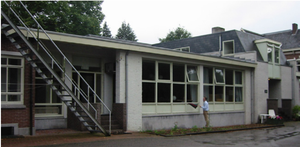
Middenstate, medio de jaren 1980 gebouwd en jarenlang de verbinding tussen Hoofdstate en Hoekstate.