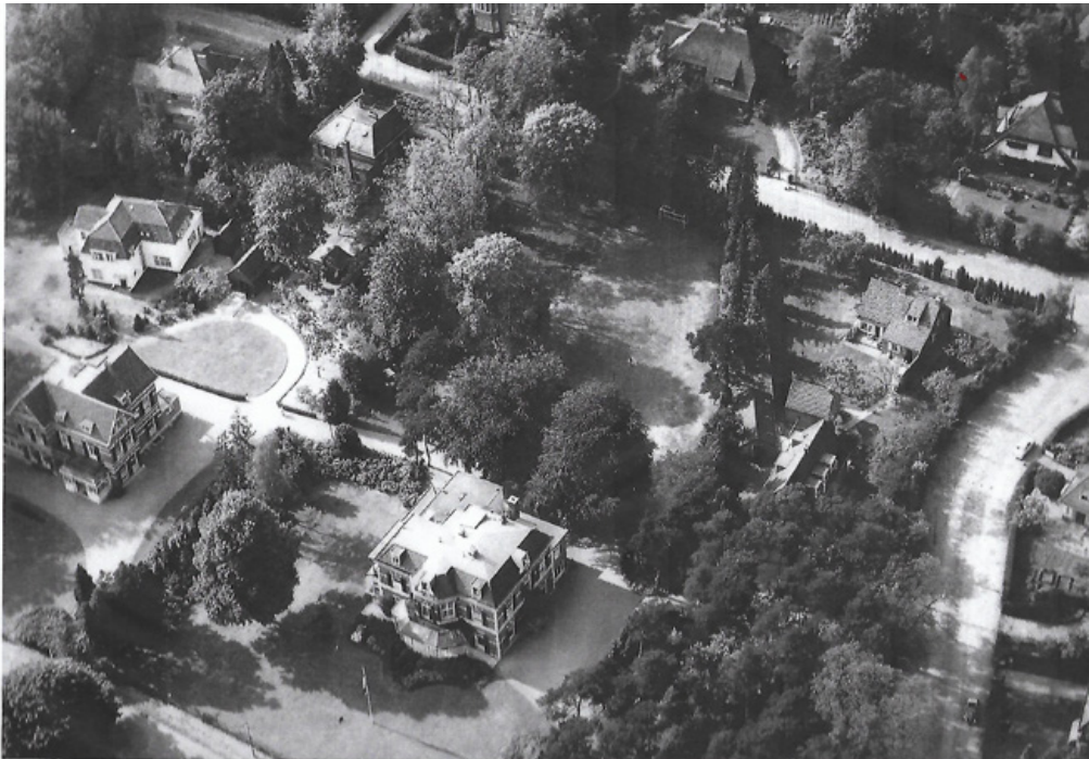
Overzichtsfoto uit 1958, van het terrein van Louisa State, met in het midden Hoofdstate, linksvoor Hoekstate en linksachter Wittestate.

deren, lukt het om de kinderen elders te huisvesten. Na de oorlog doet de Louisa Stichting veel moeite haar geconfisqueerde eigendommen en kapitaal weer in handen te krijgen. De panden in Den Haag en Arnhem komen niet meer terug in haar bezit, het kapitaal wel. Daarmee kan een nieuw pand aangekocht worden, een villa, inclusief inventaris, met grote parktuin aan de Gerrit van der Veenlaan 16 in Baarn en er breekt vanaf 24 mei 1948 een nieuwe periode aan voor het internaat. 4 Omdat het aantal vrijmetselaren dat hun kinderen onderbrengt in het vernieuwde internaat achterblijft, besluit het Hoofdbestuur