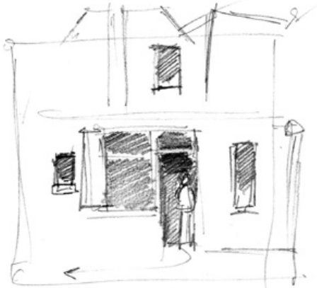
Schets van Kulla in de achterdeuropening.