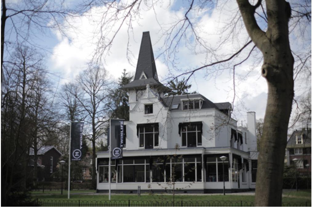
Villa Medan waar tijdens de Tweede Wereldoorlog de Sicherheitsdienst gehuisvest was.

was om deze CABR-dossiers te archiveren op slachtoffer. Voordien kon je alleen maar zoeken op dader. Dus als je niet wist wie precies je opa vermoord had, dan kon je er ook niks over terugvinden.