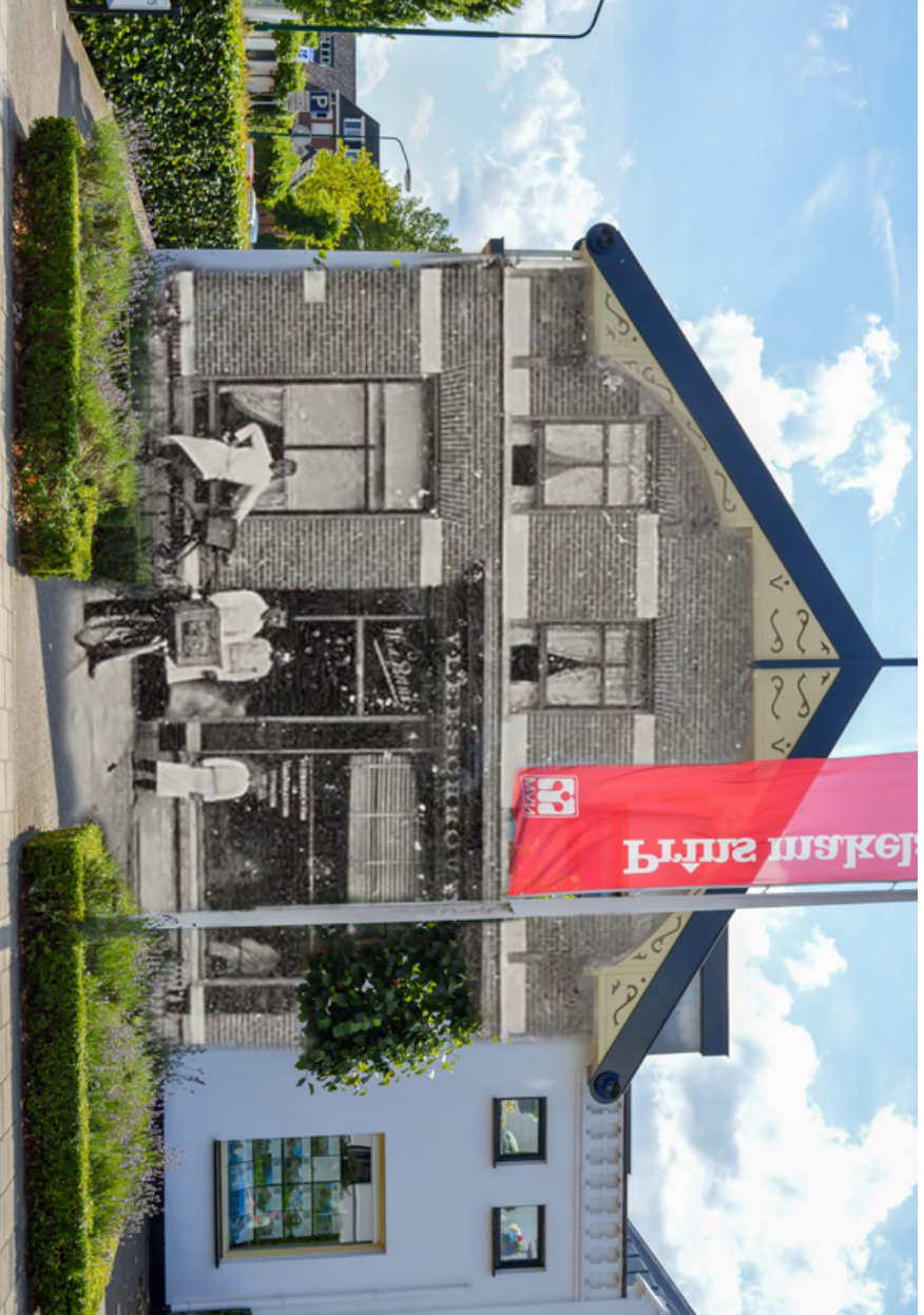
Metamorfose van Greg Lovett van het pond Eemnesserweg 55, hoek Laamplein. Huidige eigenaar Prins makelaars heeft onlangs aangegeven het te willen slopen voor nieuwbouw dat aansluit op het nog te bouwen nieuwe complex voor o.a. supermarkt Aldi dat ondermeer op percelen van de voormalige garage Kooij gevestigd zal worden.