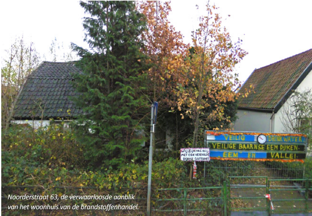
Noorderstraat 63, de verwaarloosde aanblik van het woonhuis van de brandstoffenhandel.