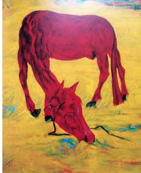
Pferd in Freiheit, 1917.

in Davos. Inmiddels zijn de schilderijen, houtsneden en aquarellen van Bauknecht te vinden in talrijke musea en particuliere collecties in Europa, Canada en de Verenigde Staten.