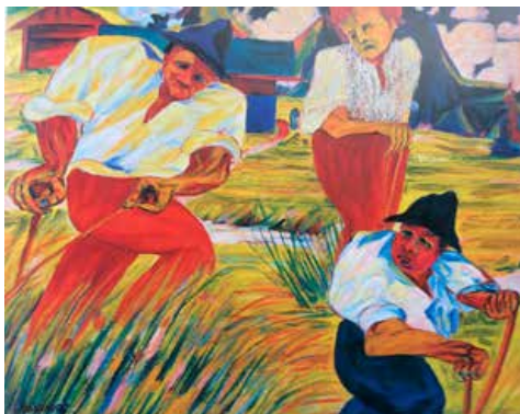
Drei Bauer auf dem Feld, 1924.