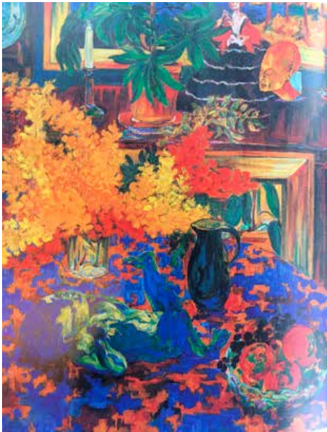
Interieur Haus in der Stilli mit Plastik, 1929-1932.