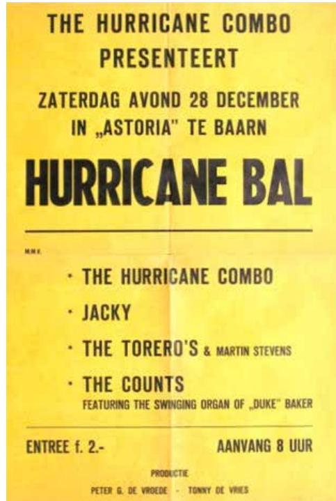
Affiche The Hurricane Bal.