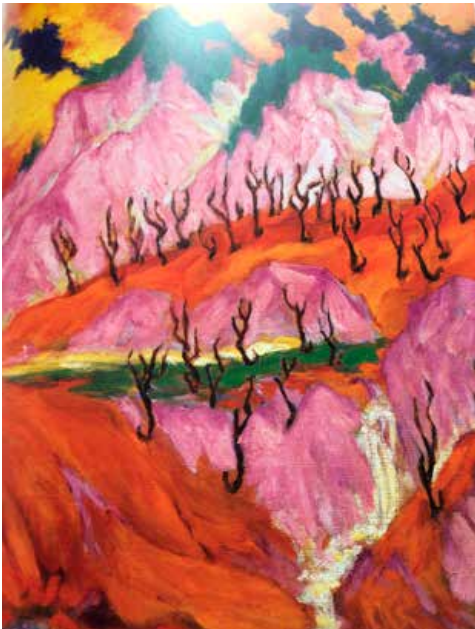
Frühling im Bündnerland, 1922.