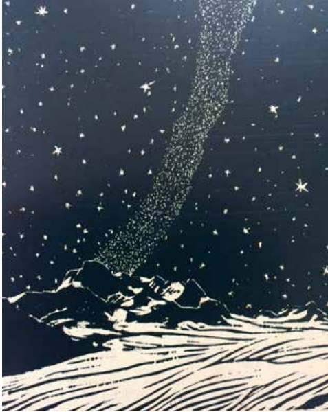
Sternennacht, houtsnede, 1916-1917.