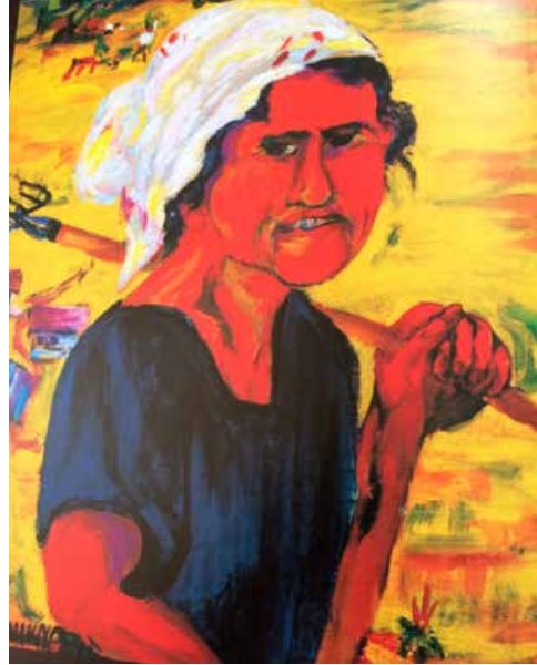
Heuerin, olieverf, 1916.