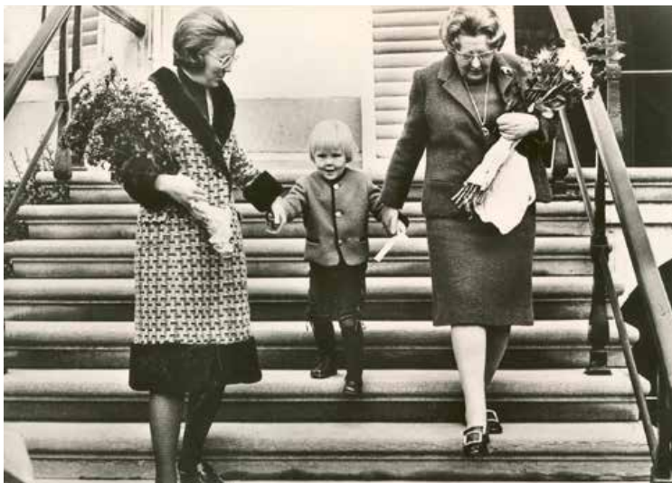
Drie generaties troonopvolgers op het bordes van paleis Soestdijk.

De banden tussen Baarn en Oranje zijn talrijk, net als de persoonlijke herinneringen aan leden van ons koningshuis in Baarn. Vandaar ons besluit om een tentoonstelling te wijden aan deze 'royale' relaties.