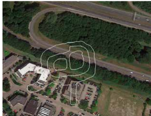
Kaart van RAAP met de ingetekende Motte-locatie.

In 1348 zou dan sprake kunnen zijn geweest van herbouw van het kasteel. Of het dan gaat over herbouw op de plaats van het oude kasteel aan noordzijde van de Eem of, door de vondst van de sporen onder de afrit van de A1, om nieuwbouw ter vervanging van de vernielde 'Motte' zal misschien wel altijd een raadsel blijven.