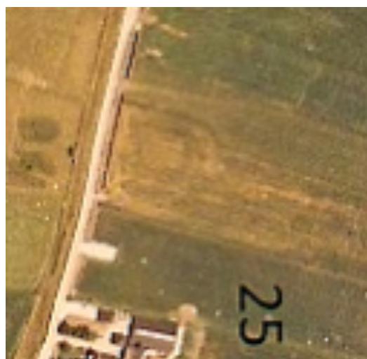
Het weiland aan het Zuidereind met