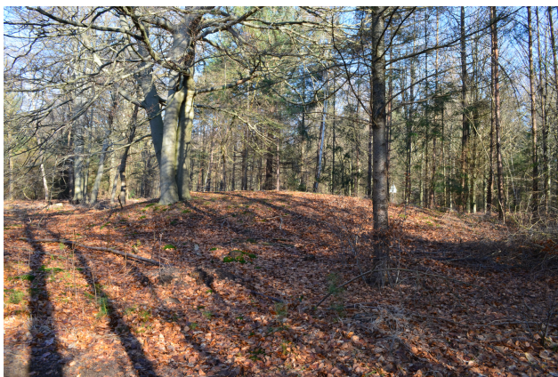
Grafheuvel 4, hoek Hoge Vuurscheweg / Zwarteweg

Met de AWN-afdeling Naerdincklant in Hilversum bestaat het contact uit het bezoeken van vergaderingen en presentaties en deelname aan elkaars opgravingen en projecten. Zo doen leden van Naerdincklant al jaren mee aan het onderhoud van onze grafheuvels.