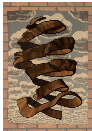
Omhuysel - Escher