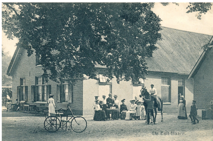
Boerderij De Eult aan de Torenlaan in 1910, genoemd naar de voormalige buitenplaats, en tot 1981 eigendom van het Koninklijk Huis.

We begroeten u graag bij deze presentatie, waarin we u beelden tonen van een Baarn dat plaats maakte voor groei en vooruitgang.