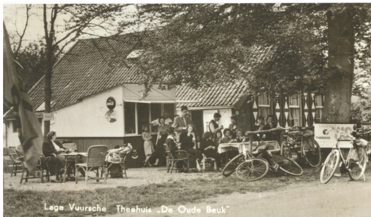
Lage Vuursche Theehuis "De Oude Beuk"

communicatie@historischekringbaerne.nl .